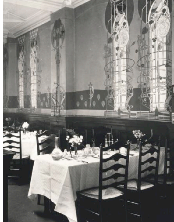
Charles Rennie Mackintosh va dissenyar el Saló de Te del carrer Buchanan el 1897