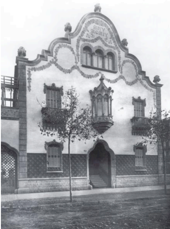
La Casa Trinxet de Josep Puig i Cadafalch, construïda el 1902-1904 i enderrocada el 1966, era considerada al seu temps una de les joies del Modernisme barceloní