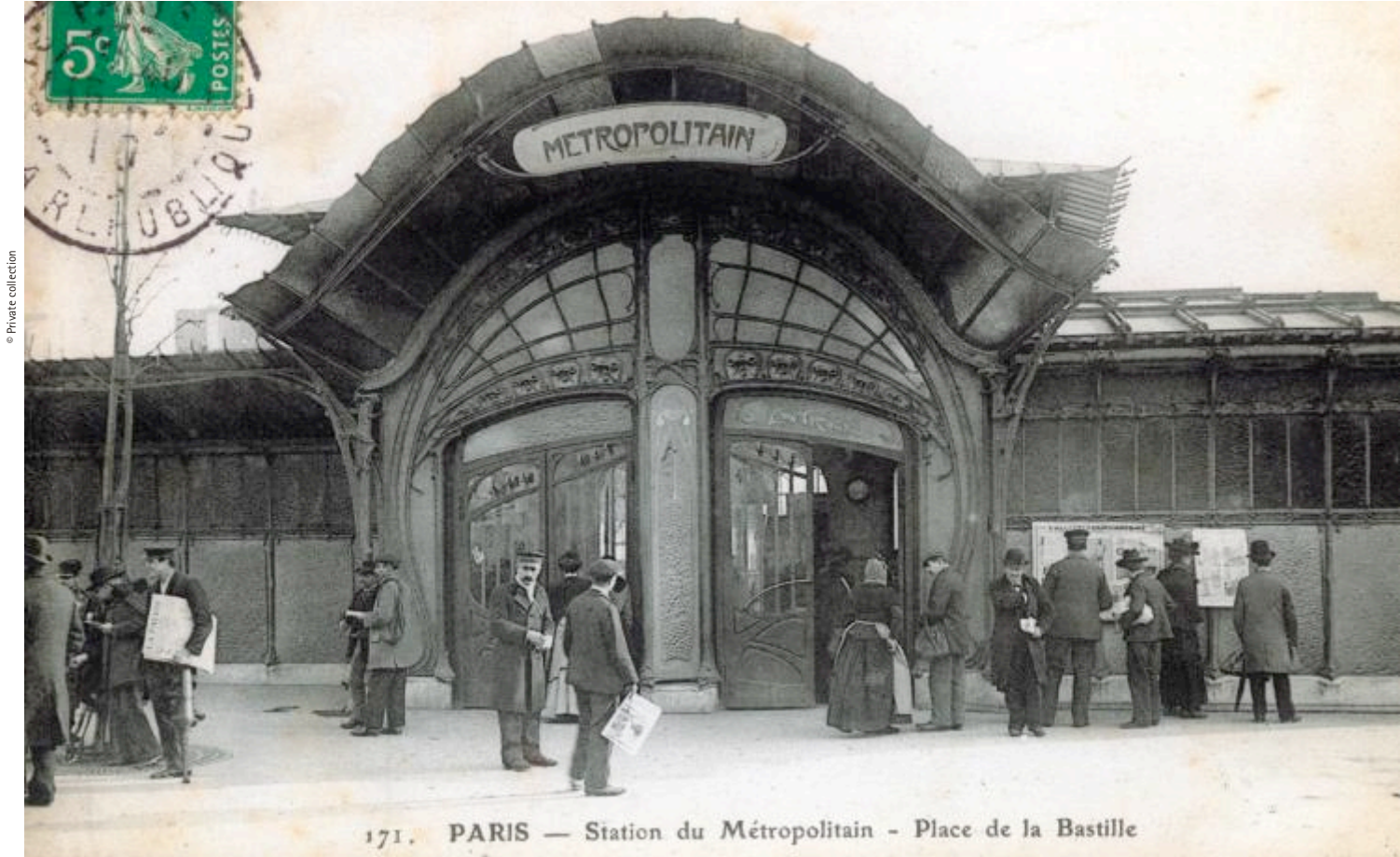
171. PARIS — Station du Métropolitain - Place de la Bastille