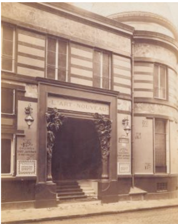
La galeria d'art L'Art Nouveau de Siegfried Bing a París

Nancy és el veritable productor de l'Art Nouveau francès. Ciutat de tradició artesanal, abans del 1900, nombroses indústries artístiques comencen a treballar a partir del programa social anglès, el simbolisme belga i el grafisme japonès. La gràcia i el refinament d'arrel rococó defineixen els seus objectes, suggestius més que funcionals. Émile Gallé, que n'és l'impulsor, porta les seves peces de vidre policromes d'estil floral a la màxima perfecció, crea «objectes parlants», volumètrics i de formes vegetals vives. Després de l'èxit a l'Exposició de París es funda l'École de Nancy, aglutinadora de la comunitat d'artistes-artesans que fan dels objectes quotidians autèntics articles de luxe, exuberants i d'aparença vegetal.