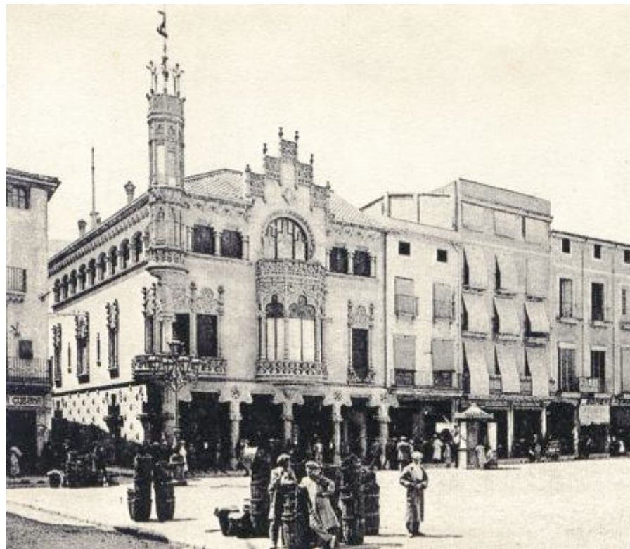
Aspecte original de la Casa Navàs de Reus, obra de Lluís Domènech i Montaner (1902). Alguns elements, com la torreta de la cantonada, es van perdre durant la Guerra Civil