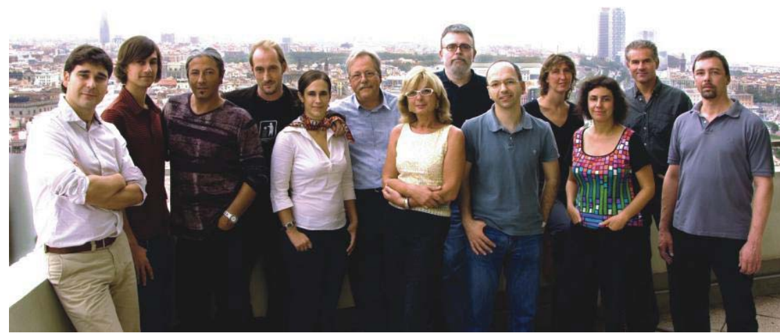
Our editorial team, from left to right: / El nostre equip editorial, d'esquerra a dreta: