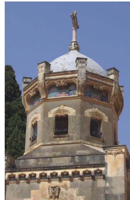
Basile built the chapel of the Lanza di Scalea family ("Capella Gentilizia") in the Santa Maria di Gesù cemetery of Palermo in 1900-1901

It was in these central years of Basile's activity that, through cooperation with Palermo companies (such as the Carlo Golia & C.