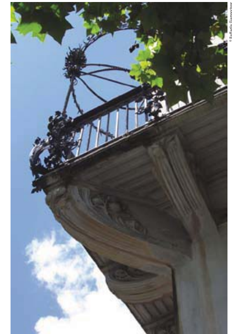
Detail of a balcony of Villino Basile (1903-1906) in Palermo Detall d'un balcó del Villino Basile (1903-1906) a Palerm

Basile va construir la capella de la família Lanza di Scalea al cementiri de Santa Maria di Gesù de Palerm entre 1900 i 1901