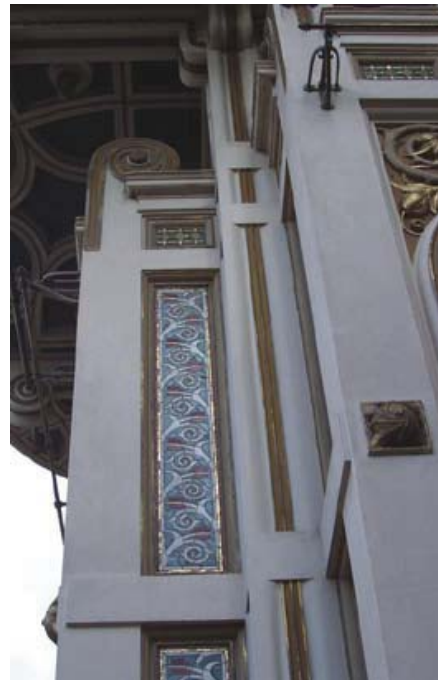
Chiosco Ribauda at Castelnovo square in Palermo (1916) Chiosco Ribauda a la plaça Castelnovo de Palerm (1916)

El segle XX va començar per a Basile amb el que els crítics han anomenat la seva fase de "Modernisme regionalista", en què l'element local pren un lloc cada vegada més destacat. El Villino Fassini, el Villino Basile i el Villino Monroy (tots ells enderrocats) són perles del cicle anomenat "vil·les blanques", desenvolupat durant els anys 1903 i 1904. Combinant un sistema arquitectònic lligat al confort amb un estil mediterrani comú a la tradició costera ibèrica i islàmica, va crear unes obres arquitectòniques ben allunyades de la plasticitat decorativa típica dels codis eclèctics dels seus primers anys.