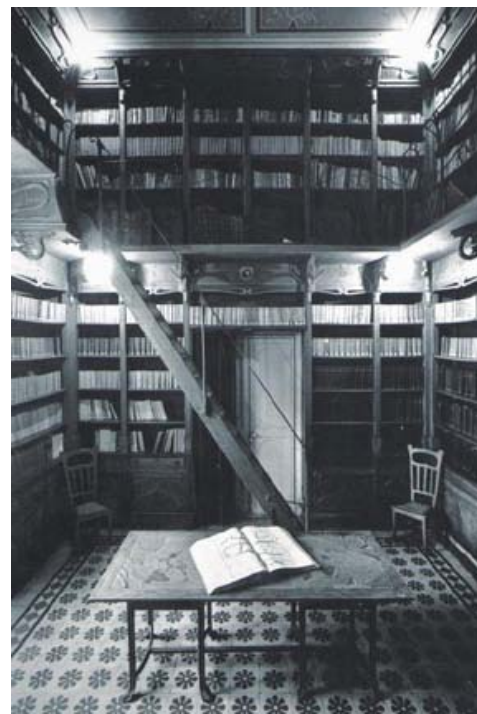
Period photograph of the library of Palazzo Francavilla (1899) Foto d'època de la biblioteca del Palazzo Francavilla (1899)

Raffaella Giamportone Architect, Palermo