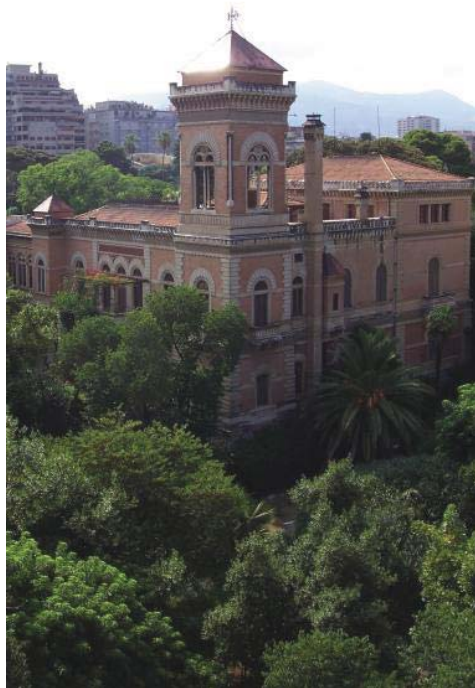
General view of Villa Chiaramonte Bordonaro, one of Ernesto Basile's early works (1893-1896) Vista general de la Vila Chiaramonte Bordonaro, una de les obres primerenques d'Ernesto Basile (1893-1896)

Durant la dècada de 1890 es va concentrar en la modernització de diverses mansions nobles (Palau Francavilla, Palau Chiaramonte-Bordonaro), encàrrecs que rebia de ciutadans acabats de Palerm. La seva feina més notable va ser l'acabament, el 1897, del projecte del teatre Massimo Vittorio Emanuele II de Palerm, que havia iniciat el seu pare. Aquest projecte, juntament amb un viatge que va realitzar l'any 1898 a Viena, bressol del nou moviment del Secessionstil, va significar l'abandó d'una fase experimental en el marc de la cultura romàntica i acadèmica, amb la qual sembla que va mantenir una relació de sintonia crítica, i el pas a la reivindicació d'un model autòcton en nom d'aquells vents de canvi que aleshores bufaven també a Sicília.