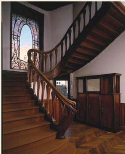
Staircase, with stained glass by Jacques Gruber and book cabinet by Louis Majorelle himself Caixa d'escala, amb vitrall de Jacques Gruber i moble biblioteca del mateix Louis Majorelle

glass by Gruber, an inlaid sideboard and piano, as well as several bronze and glass light fittings done in collaboration with the Daum factory. On the first floor, the couple's bedroom reflects a different concept from that of Majorelle. This ensemble, now on show in the Musée de l'École de Nancy, appears not to have been repeated. Similarly, the decorative element of nature present throughout the rest of the building appears in this room only in the form of abstract motifs of curves, counter-curves and intertwined lines. A living place before becoming a history-laden piece of national heritage, the entire house reflects the savoir faire of the decorative artist as much as the taste of the home's owner for modern and artistic objects.