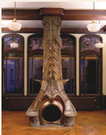
Fireplace by Alexandre Bigot, and stained-glass windows by Jacques Gruber Xemeneya d'Alexandre Bigot i vitralls de Jacques Gruber