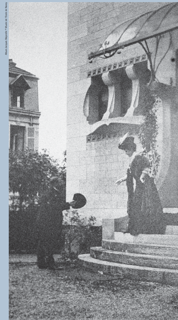
Period photograph of Louis Majorelle and his wife, Jeanne Kretz, at the stairs of the main entrance

The "Wheat, Rich Model" dining room, which appeared from 1904 in Majorelle's catalogues, demonstrates decorative harmony and the strong link that united all the arts at the beginning of the 20th century: the fireplace in flambé sandstone by Bigot, stained glass windows by Gruber, paintings by Jourdain, furniture and panelling by Majorelle. All these elements are in place today and constitute a high point of a visit to Villa Majorelle. The lounge room was equally celebrated in the press and appeared in Majorelle's sales catalogues to promote the "Pine Cone" lounge room. Alongside the mass-produced furniture (chairs, armchairs, window seats), there were several one-off or limited edition items, such as the grand fireplace adorned with Japanese-style stained