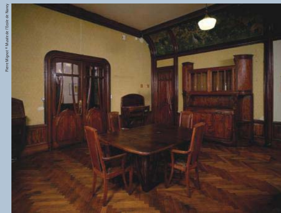
"Wheat, Rich Model" dining room by Louis Majorelle, with paintings by Francis Jourdain Menjador "Els blats, model ric" de Louis Majorelle, amb pintures de Francis Jourdain

"Pine Cone" lounge of Villa Majorelle, published in Louis Majorelle's catalogue, c1905 / Saló "Pinya" de la Vil·la Majorelle, fotografia publicada al catàleg de Louis Majorelle, ca. 1905