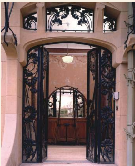
View of the main entrance leading into the hall Vista de l'entrada principal cap al vestíbul