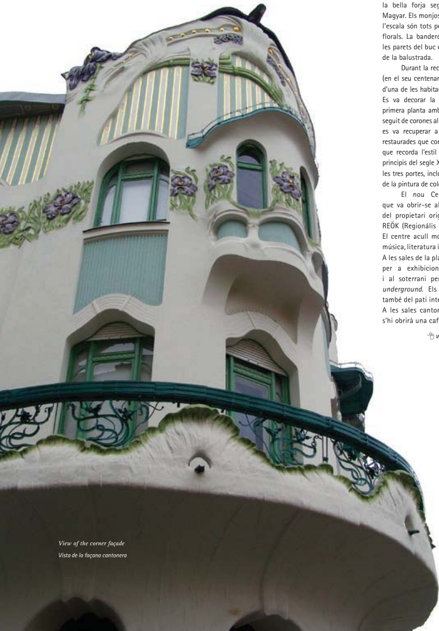
View of the corner façade Vista de la façana cantonera

la bella forja seguint els dissenys d'Ede Magyar. Els monjos de la finestra del buc de l'escala són tots peces úniques amb motius florals. La banderola ondulant que adorna les parets del buc complementen el fullatge de la balustrada.