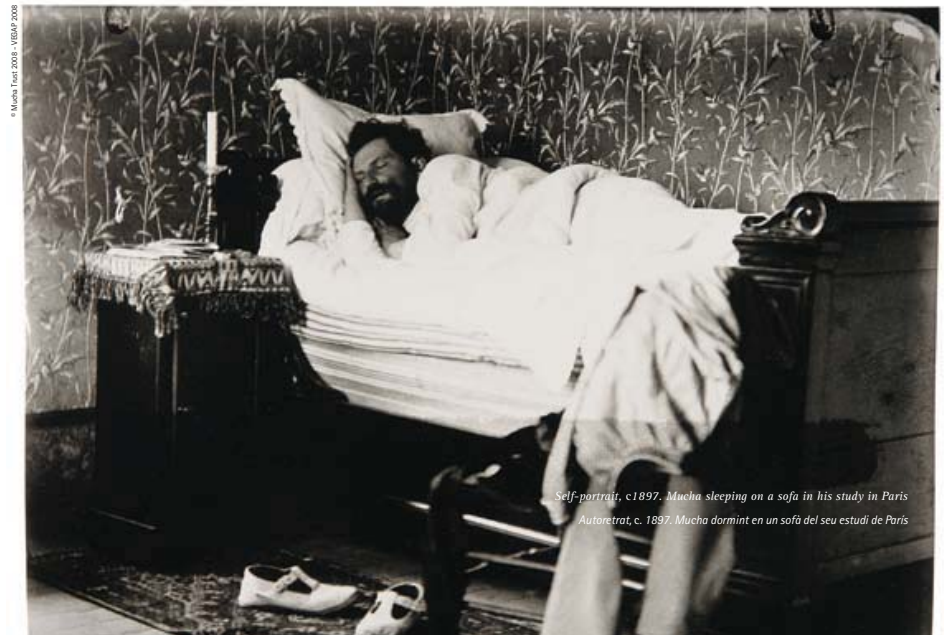
Self-portrait, c1897. Mucha sleeping on a sofa in his study in Paris Autoretrat, c. 1897. Mucha dormint en un sofà del seu estudi de París

His controversial contribution to Prague's Town Hall expresses an eclectic style that in some respects connects with what would