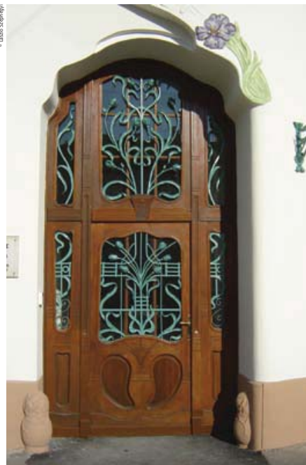
Main entrance door