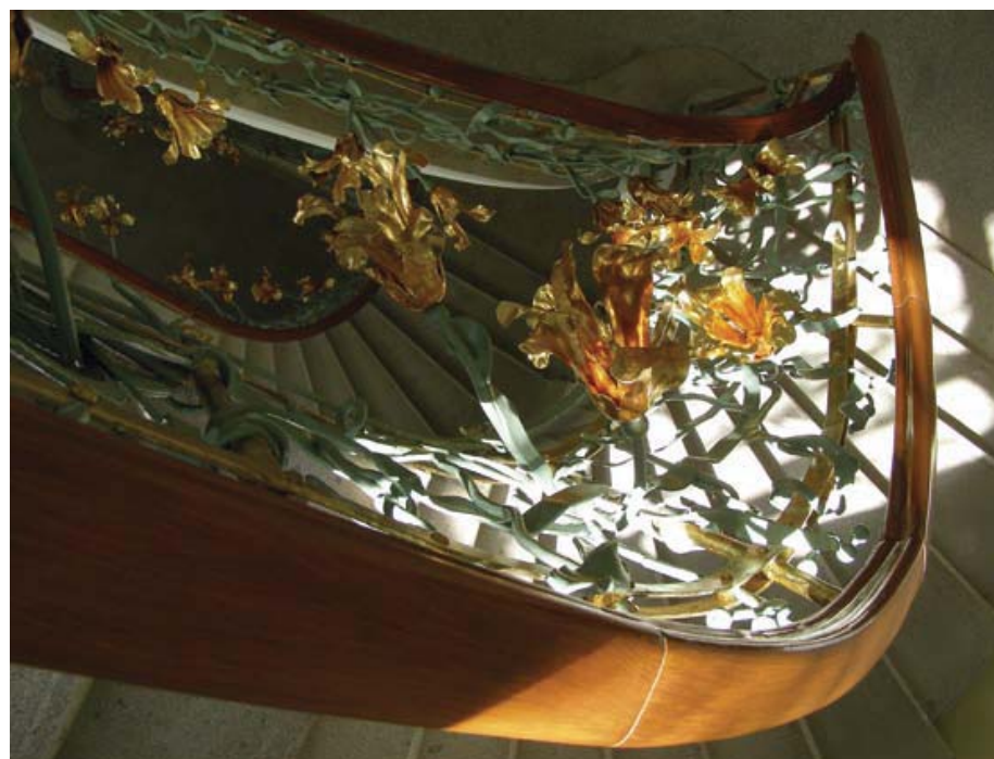
Stairwell, viewed from above

També al buc de l'escala hi trobem ornaments florals. El fullatge de les balustrades de forja es cargola al voltant d'una barra fins a un ram de flors. Els lliris que ondulen entre la decoració de jònqueres de les balustres converteixen el buc en una enorme planta enfiladissa daurada. Pál Fekete, un prolífic ferrer modernista hongarès de Szeged, va realitzar