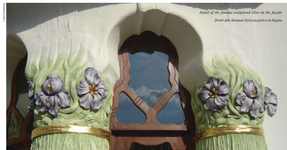
Detail of the famous sculptured lilies on the façade Detall dels famosos lliris esculpits a la façana

The facade of the two-storey building is decorated with sculptured reliefs. The oriels and balconies are supported with floral motives, the balustrades and pillars ornamented with lilies hint at the occupation of the patron. The lilies having lilac petals and golden anthers that are entwined on the wavy surfaces resemble the flora of the River Tisza. The seccos under the cornices were originally decorated with naked water fairies but they were removed not long after the building was accomplished due to the wish of some conservative female members of the family. Today we can see the green striped ornaments here. The arched walnut portals and windows suit the dynamism of the facade.