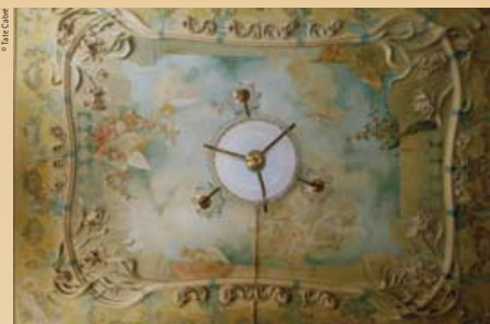
Gaietà Buigas, 1901. Ceiling of the Villa Avelina, property of Bonaventura Blay, now converted into a hotel, Sitges