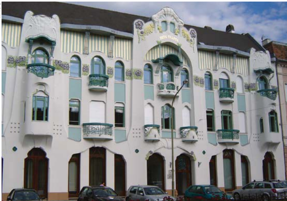
Main façade of Reök Palace