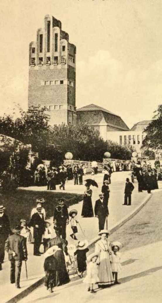
Hesse State Exhibition of Fine and Decorative Arts on the Mathildenhöhe, Postcard from 1908