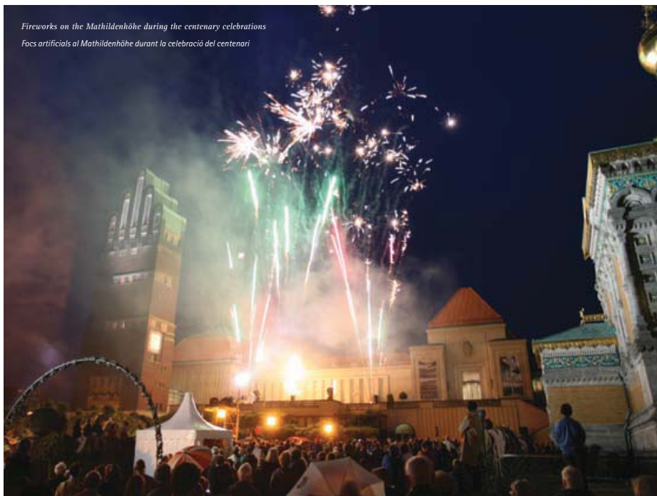
Fireworks on the Mathildenhöhe during the centenary celebrations Focs artificials al Mathildenhöhe durant la celebració del centenari