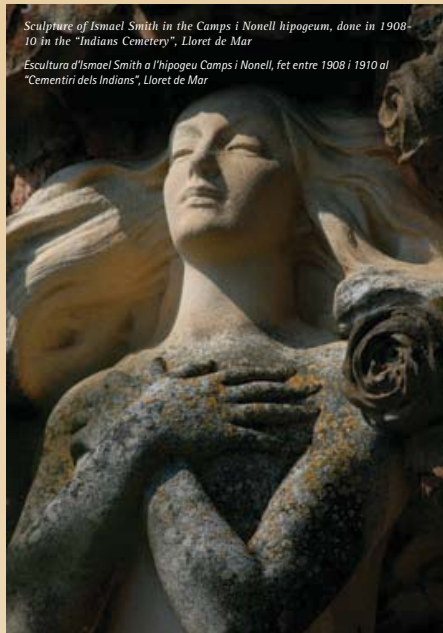
Sculpture of Ismael Smith in the Camps in Nonell hipogeum, done in 1908-10 in the "Indians Cemetery", Lloret de Mar Escultura d'Ismael Smith a l'hipogeu Camps i Nonell, fet entre 1908 i 1910 al "Cementiri dels Indians", Lloret de Mar

Van ser projectades amb passió pels indians que arribaven d'Amèrica ansiosos de proclamar les seves noves fortunes ultramarines als seus conciutadans, i que amb aquest objectiu adquirien títols nobiliaris, fundaven clubs socials, arreglaven matrimonis de conveniència amb altres famílies indiantes multimilionàries i estampaven les seves inicials a façanes, balcons, vaixells, automòbils... i a tot arreu on podien.