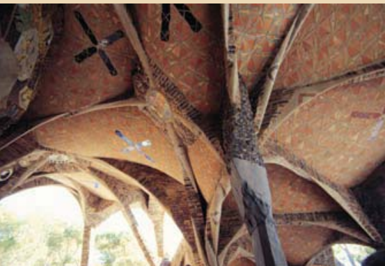
Antoni Gaudí, 1908. Ceiling of the Güell Crypt, Santa Coloma de Cervelló