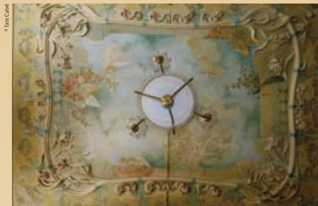
Gaietà Buigas, 1901. Ceiling of the Villa Avelina, property of Bonaventura Blay, now converted into a hotel, Sitges