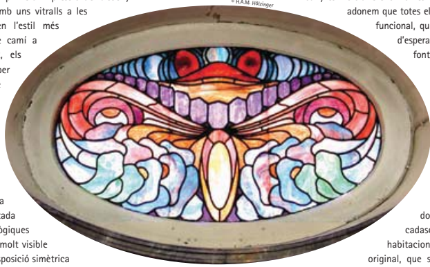
Stained glass window in bathhouse 5 waiting hall, 1905-1906