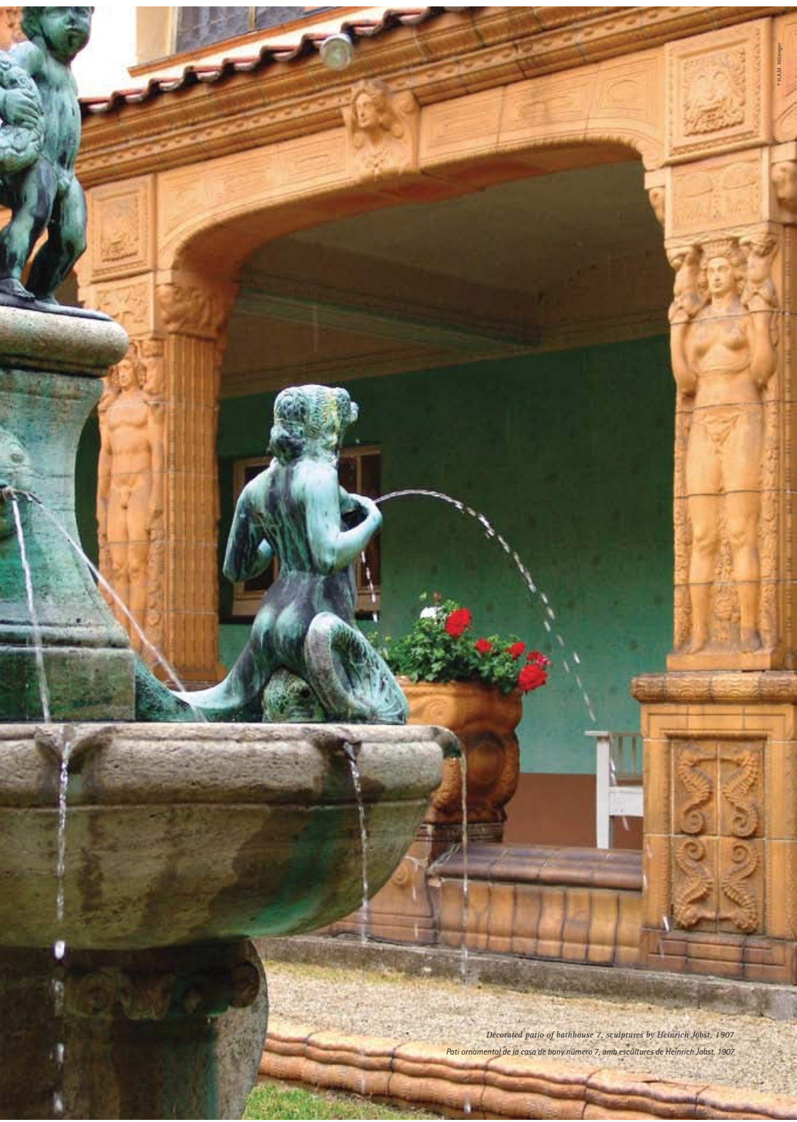
Decorated patio of bathhouse 7, sculptures by Heinrich Jobst, 1907 Pati ornamental de la casa de bany número 7, amb escultures de Heinrich Jobst, 1907

first detached bathhouses with curved patina turrets and discovered further buildings hidden behind the arcades of the pump rooms. To this day, the socketed fountain basin embellished by mythological figures remains the highly visible centre of the complex. If the symmetrical arrangement and large constructions remind the beholder vaguely of baroque architectural models, the imaginative decor shows numerous elements of the Art Nouveau era. Details such as wrought-iron work, banisters and lamps or curved bands with golden globes in the façade (the latter symbolising small carbonic acid bubbles) remind us mainly of the geometric ornamental designs of the artists' colony at Mathildenhöhe. What Archduke Ernst-Ludwig, through initiating the artists' colony in Darmstadt, hoped to achieve in the State of Hesse found an independent interpretation through Wilhelm Jost in Bad Nauheim. The new genre of Art Nouveau developed roots in everyday life and inspired artists as well as artisans to create works of a new beauty and quality.