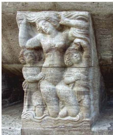
Heinrich Jost, 1911. Detail of one of the figurative reliefs carved on shell limestone that support the main spring

El Bany del Príncep —utilitzat per última vegada pel príncep Ibn Saud el 1959 — amb pintures de Wilhelm Koeppen