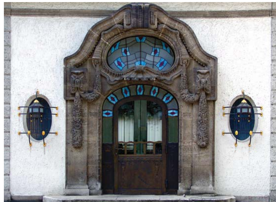
Doorway of the administrative building, completed by Wilhelm Jost in 1906. The frame recalls Baroque models, yet its elements are clearly inspired by Jugendstil

Porta de l'edifici administratiu, realitzada el 1906 per Wilhelm Jost. Si bé el marc recorda els models barrocs, els elements s'inspiren clarament en el Jugendstil