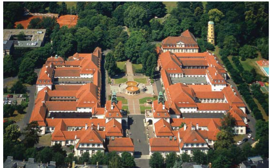
Aerial view of the Sprudelhof Vista aèria de l'Sprudelhof