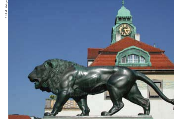
The walking lion of Hesse, by Heinrich Jobst. Behind it rises the curved patina turret of bathhouse 5

Jost hoped that the artistic furnishing of the rooms would have a positive effect on the patients' psyche and so aid their recovery. The ornamental courtyard and waiting area of bathhouse 7 display terracotta wall covering and enamelled tiles. These were designed by the grand-ducal ceramic works (or rather its director,