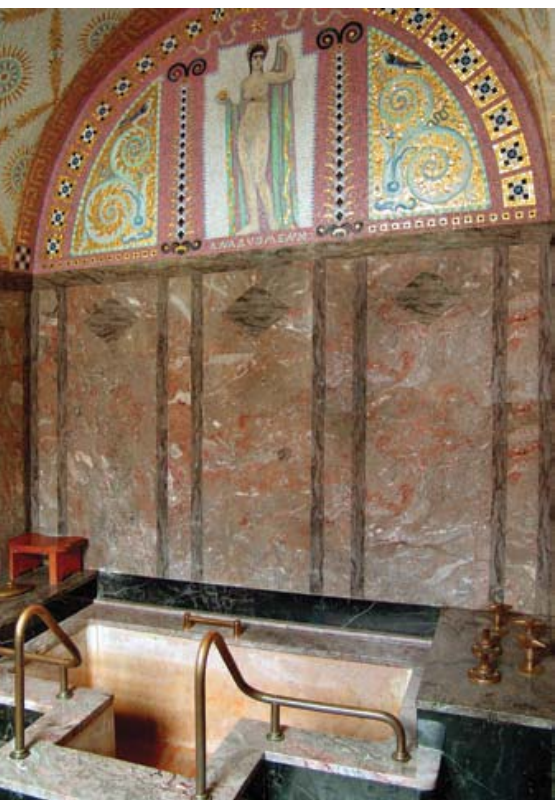
The Prince's Bath - last used by Prince Ibn Saud in 1959 - with paintings by Wilhelm Koeppen

A banda de l'Sprudelhof, Bad Nauheim té molt més per oferir: l'arquitecte Jost va dissenyar un edifici de calderes i una bugaderia de grans dimensions a l'altre costat de l'estació. Va dissenyar el canó de la xemeneia