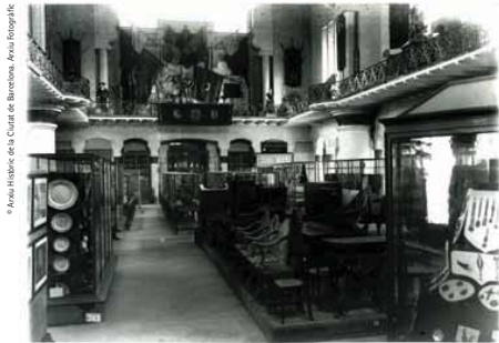
Photo of the building when it was the History Museum (1892-96). Lluís Domènech himself directed the arrangement of the collections Fotografia de l'edifici quan era Museu de la Història (1892-1896); la disposició de les col·leccions va ser dirigida pel mateix Lluís Domènech