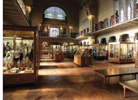
View today of the room used for the permanent exhibition, on the first floor Aspecte actual de la sala dedicada a l'exposició permanent, ubicada a la primera planta