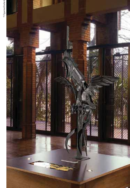
Replica of one of the Homage Tower cocks, on show in the exhibition. Behind it one sees the double column structure that holds the building up in spite of it having little in the way of foundations

Replica d'un dels galls de la Torre de l'Homenatge, mostrada a l'exposició. Al darrere es pot apreciar la doble estructura de columnes que permet que l'edifici se sostingui malgrat tenir pocs fonaments