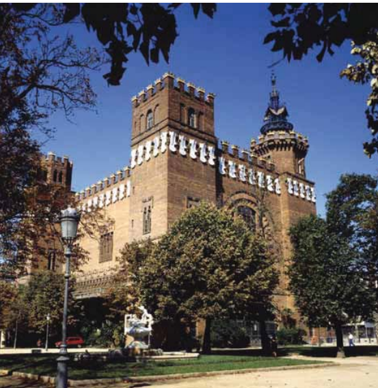
General view of the building from the Ciutatella park Vista general de l'edifici des del parc de la Ciutatella

Un seguit de contratemps varen impedir acabar-lo completament per a l'Exposició, tot i que s'obrí al públic durant quatre mesos i acollí diversos banquets. Les seves generoses dimensions, amb dos salons de 450 m 2 cadascun destinats a café (planta baixa) i restaurant (planta primera), estaven pensades per als barcelonins i per als turistes, en una època en què els grans cafès d'arreu del món es construïen sumptuosos i amb gran luxe.