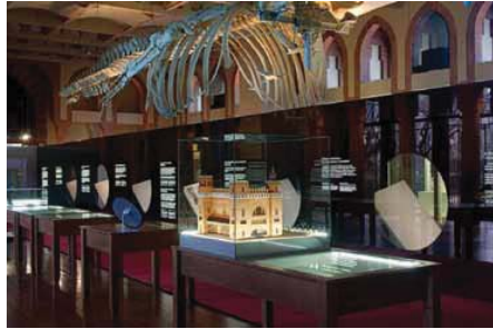
View of the exhibition, The Castle of the Three Dragons. From Restaurant to the Natural Sciences Museum. Above the displays hangs the museum's famous whale skeleton Aspecte de l'exposició El Castell dels Tres Dragons. De Restaurant a Museu de Ciències Naturals. Sobre els expositors, el famós esquelet de balena del Museu

Poc després hi tindríem lloc un episodi significatiu en la història de l'art català, l'anomenat "taller del Castell dels Tres Dragons", considerat erròniament com l'origen de les arts decoratives del Modernisme. El fet és que, concloua l'Exposició, Domènech tornà per acabar l'edifici amb Antoni Maria Gallissà com a arquitecte auxiliar. Com que la part arquitectònica i la decorativa tenien infinitat de detalls que calia supervisar, s'establiren quatre obradors dedicats a metal·listeria, serralleria, repusat i modelat on es va fer tot allò que faltava, com peces de ferro, detalls de forja, aplicats de metall i models ceràmics. Aquests obradors funcionaren de forma desigual entre març i novembre de 1892. En aquells dies Domènech va rebre visites ocasionals de l'escultor Eusebi Arnau, el vitraller Antoni Rigalt, el ceramista Pau Pujol o l'arquitecte Josep Puig i Cadafalch que s'interessaven per recuperar procediments antics i aplicar-los a la nova arquitectura. Així ho recordà Domènech en morir el seu amic Gallissà en un article al diari La Renaixensa el 1903 que, de tan emotiu, induí els historiadors a l'equívoc i a mitificar els obradors esmentats.