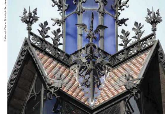
Detail of the Homage Tower, with wrought iron elements reminiscent of the Middle Ages and a crowing cock at the centre

The building's two floors had separate access and this, in time, led to the division of these spaces for different uses. The History Museum (1892-1896) moved into the ground floor, followed by the Municipal Music School (1896-1928) and, during the Second Spanish Republic (1931-1939), municipal administrative and social offices. In 1917, the first floor was made the seat of the Natural Sciences Museum of Catalonia and architect Antoni de Falguera renovated it, removing the original decoration, which was not at all