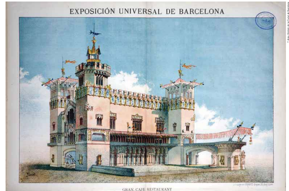
Lluís Domènech's project in a lithograph by Forasté, after a drawing by Vilardell, published in La Exposición magazine in 1887 Litografía de Forasté segons un dibuix de Vilardell que representa el projecte de Lluís Domènech. Publicada a la revista La Exposición el 1887

Shortly thereafter, a key episode in the history of Catalan art took place here, the so-called "Castle of the Three Dragons Workshop", wrongly considered the beginning of Modernista decorative arts. What happened was a little different. Once the Exhibition was over, Domènech returned to complete the site with Antoni Maria Gallissà as his righthand architect. Since the architectural and decorative work involved endless details requiring constant supervision, four workshops dedicated to metalwork, locksmiths, relief work and modelling were set up. They produced everything needed, from iron pieces and wrought metal to metal appliqué and ceramic models. These workshops worked in haphazard