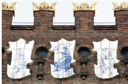
Ceramic coats of arms designed by Josep Llimona and Alexandre de Riquer, and produced by Pujol i Bausis Escuts ceràmics dibuixats per Josep Llimona i Alexandre de Riquer i fabricats per Pujol i Bausis