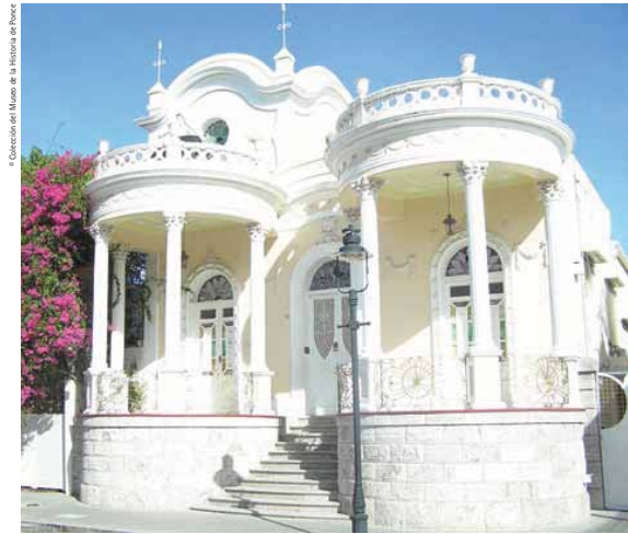
Façade of Casa Font Ubides-Monsanto, built in 1913