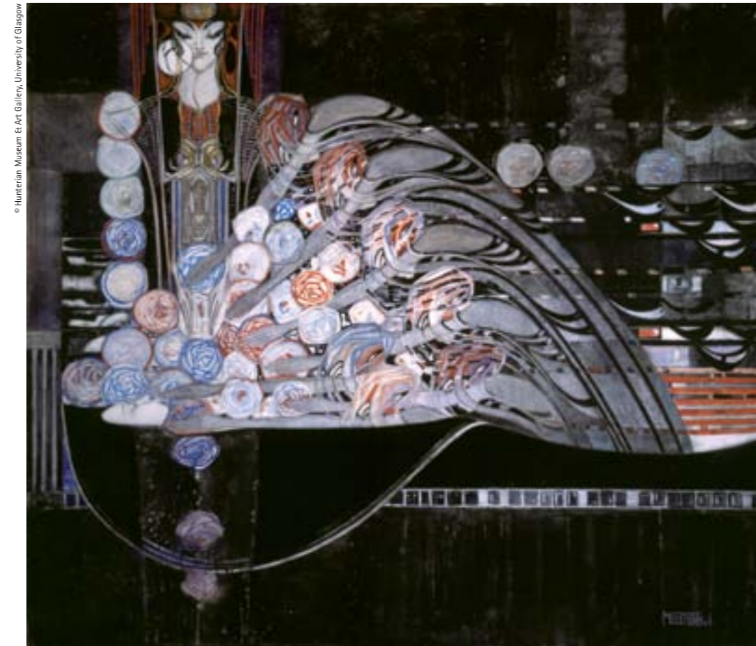
La Mort Parfumée (Perfumed Death), 1921. Watercolour. 63 x 71.2 cm

Margaret Macdonald, 1902. Plafó per a The Hill House, Helensburgh. Lli amb seda, metall, galó, cinta i granadura de vidre, 182,2 x 40,6 cm