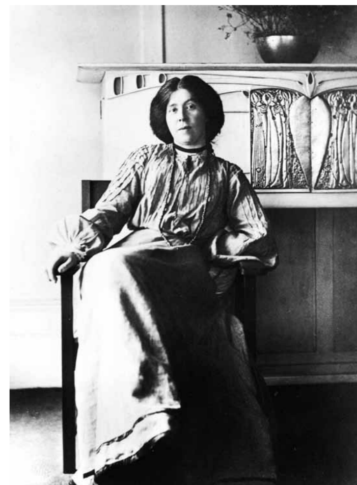
Margaret Macdonald Mackintosh, c.1900

Macdonald was born in England in 1864. The years up until the family's move to Glasgow around 1890 are poorly documented. From 1890 to the mid-1890s she and her sister Frances attended the Glasgow School of Art, where they set up an informal artistic alliance with two young architectural apprentices, Mackintosh and J. Herbert McNair. That alliance became known as the Spook School. Frances and McNair married in 1899 and moved to Liverpool. Macdonald and Mackintosh married the following year.