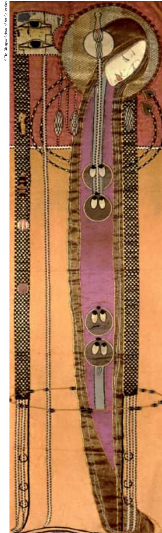
Margaret Macdonald, 1902. Panel for The Hill House, Helensburgh. Linen with silk, metal, braid, ribbon, and glass beads. 182.2 x 40.6 cm