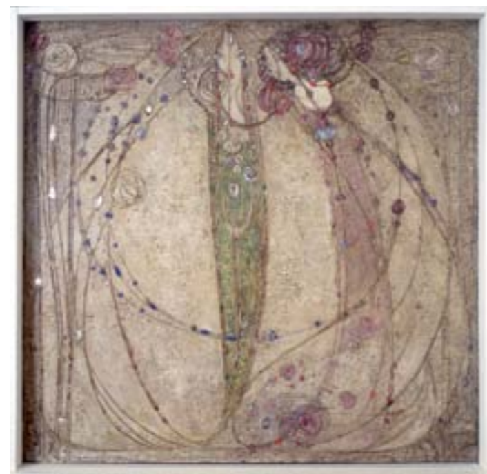
Margaret Macdonald, 1902. The White Rose and the Red Rose. Painted gesso on hessian, set with glass beads and shell. 99 x 101,5 cm