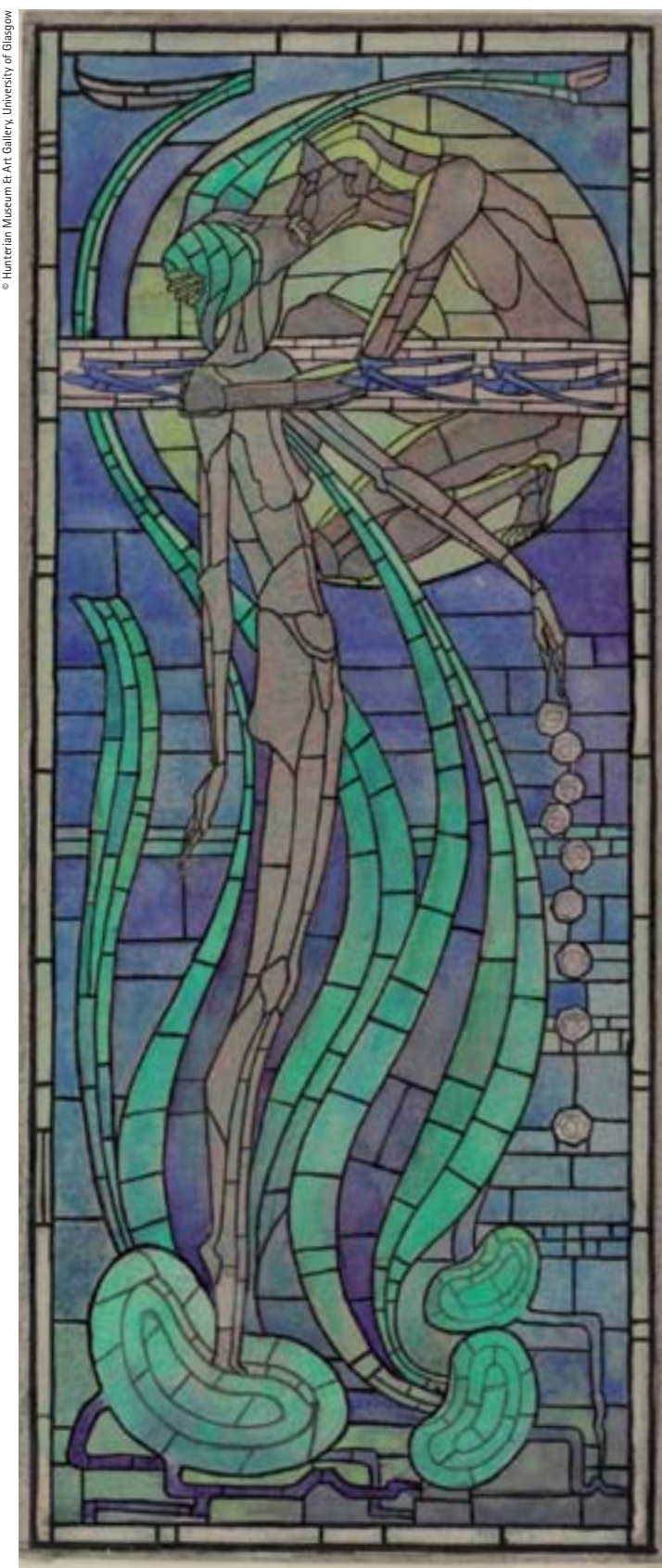
Margaret Macdonald, c.1894. Summer. Pen and ink, pencil and watercolour. 51,7 x 21,8 cm

Finalment, en els anys que va passar a Londres, va produir una sèrie d'aquarel·les molt emotives que potser responien a daltabaixos de la seva vida privada, en concret la mort de la seva germana, Frances, el 1921.