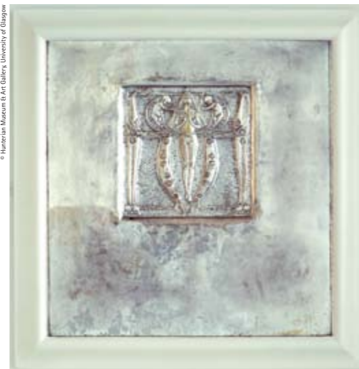
Margaret Macdonald, 1899. Silvered brass panel. 76.8 × 53.3 cm

Macdonald's career divides into three broad phases. The first comprised the experimental student years of the 1890s during which the Macdonald sisters and McNair designed across a range of media. Their gaunt stylisations defiantly challenged conventional norms of female beauty while their elusive symbolism perplexed many commentators. The work was exhibited in Liège, Paris, London and Venice and started to raise awareness of a distinctive Glasgow School of decorative design. The early 1900s were dominated by decorative panels in gesso and metal, most of which were incorporated into furniture and interiors designed by Mackintosh. Her achievements with gesso were unrivalled in Britain, and indeed further afield.