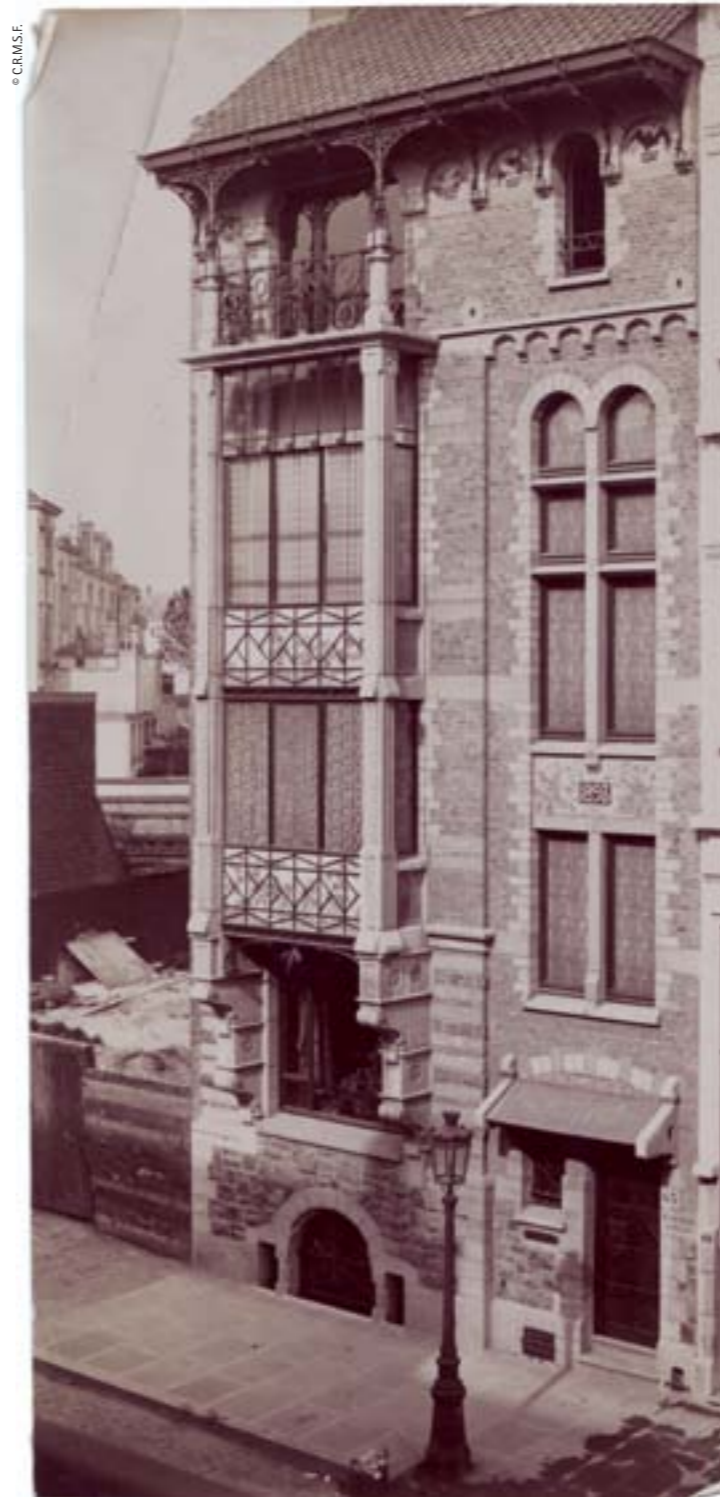
Paul Ankar's house (Brussels, 1893) strongly influenced Jaspar's work La casa de Paul Ankar (Brussel·les 1893) va tenir molta influència en l'obra de Jaspar

After World War I, the architect withdrew from the stage of modern architecture to dedicate himself to the reconstruction and preservation of historic buildings. Paul Jaspar's career in the field of modern architecture was brief but the quality of his ideas and the modernity of the materials he used showed a way forward for the young, modern architects of Liège who would appear from 1905 on. [7]