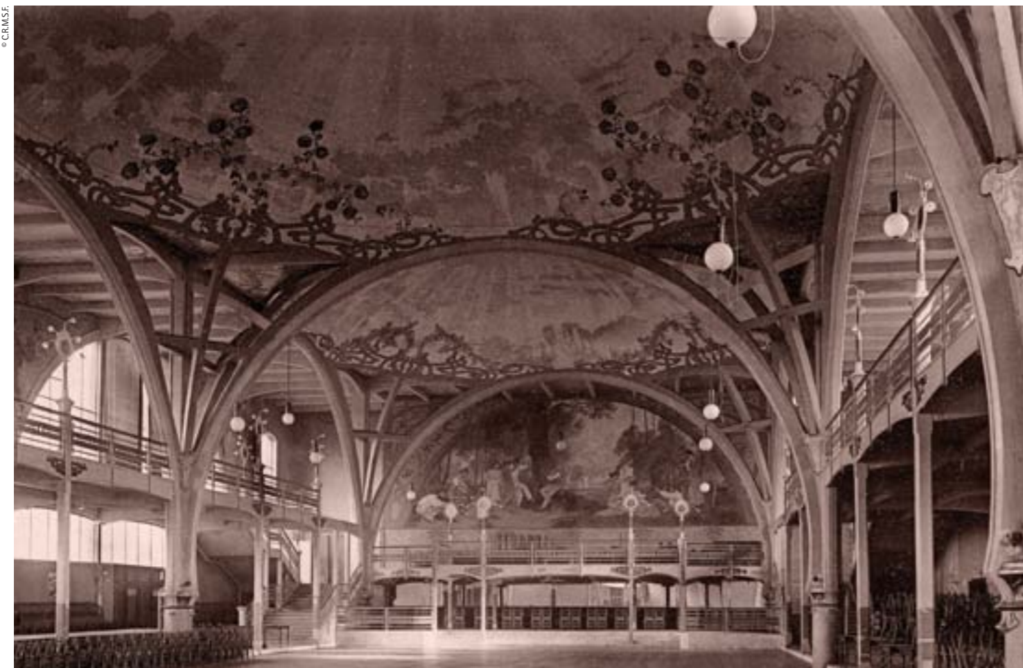
La Renommée hall, Liège. Photograph from the magazine L'Émulation, 1906 / La Renommée, Lieja. Imatge de l'interior, extreta de la revista L'Émulation, 1906