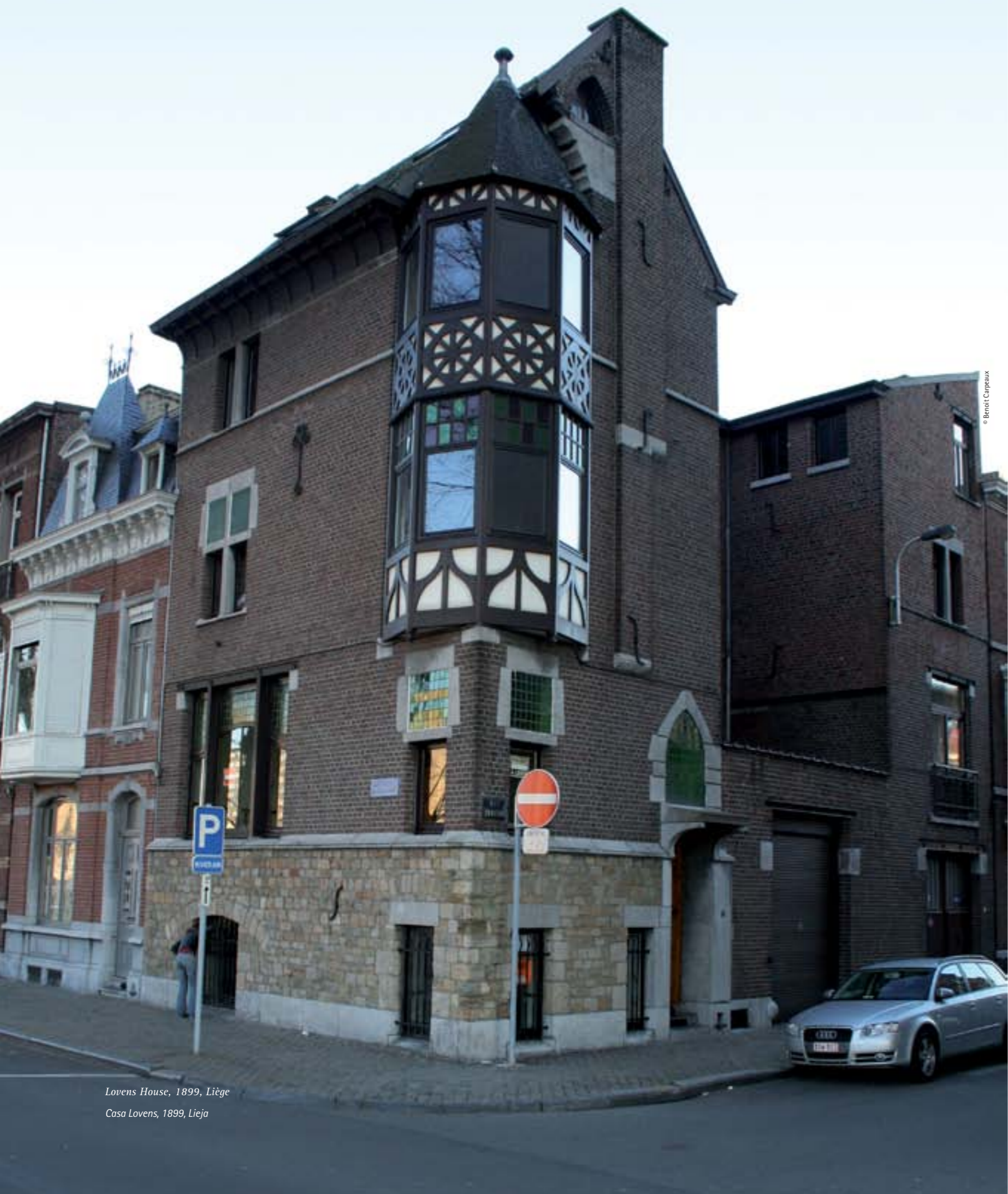
Lovens House, 1899, Liège Casa Lovens, 1899, Lieja