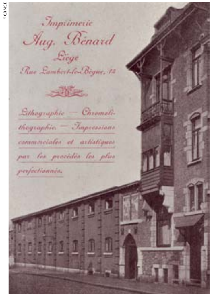
Printing establishment of A. Bénard, 1895, Liège Impremta d'A. Bénard, 1895, Lieja