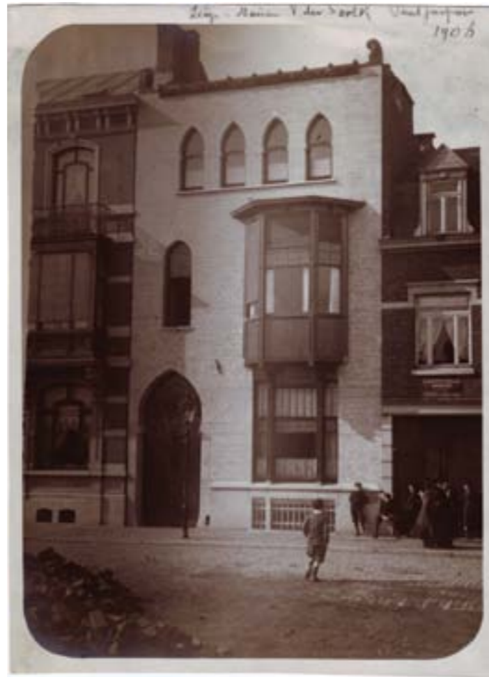
Van der Schrick House, 1906, Liège. Period photograph Casa Van der Schrick, 1906, Lieja. Fotografia d'època