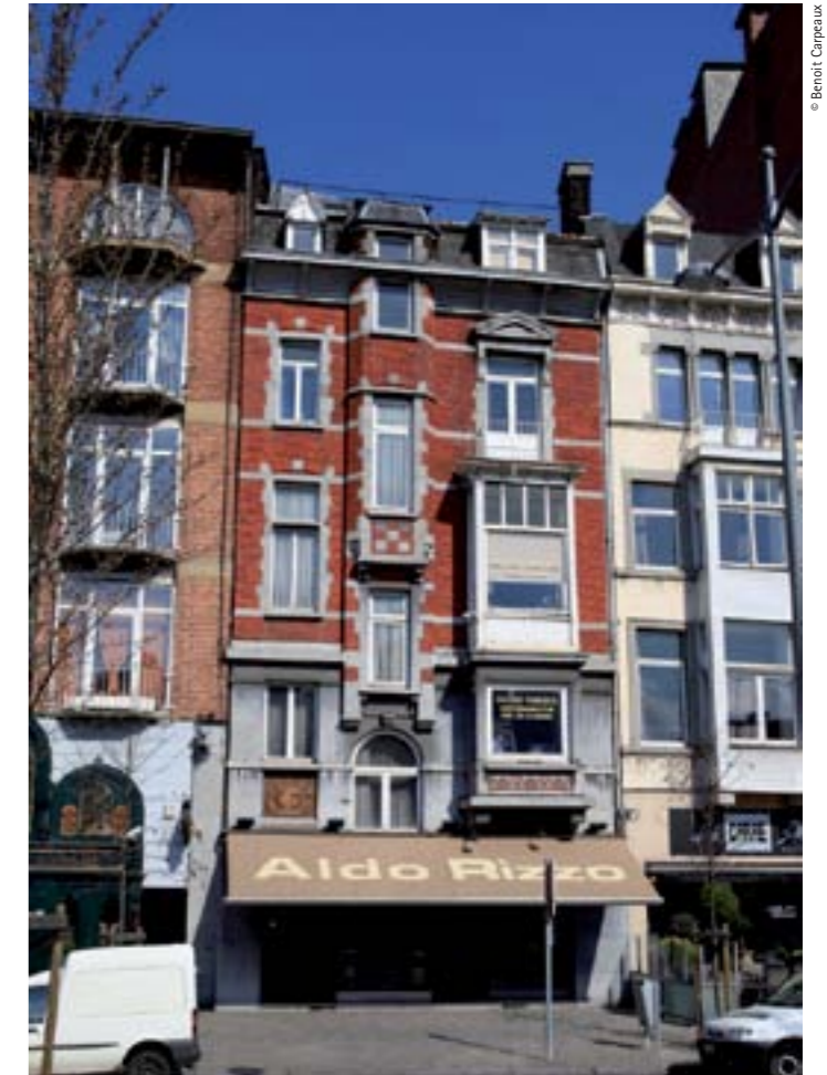
Jaspar House, 1889, Liège Casa Jaspar, 1889, Lieja