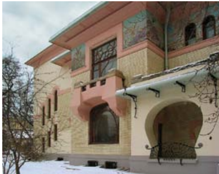
F. O. Shekhtel, 1902. Ryabushinsky House