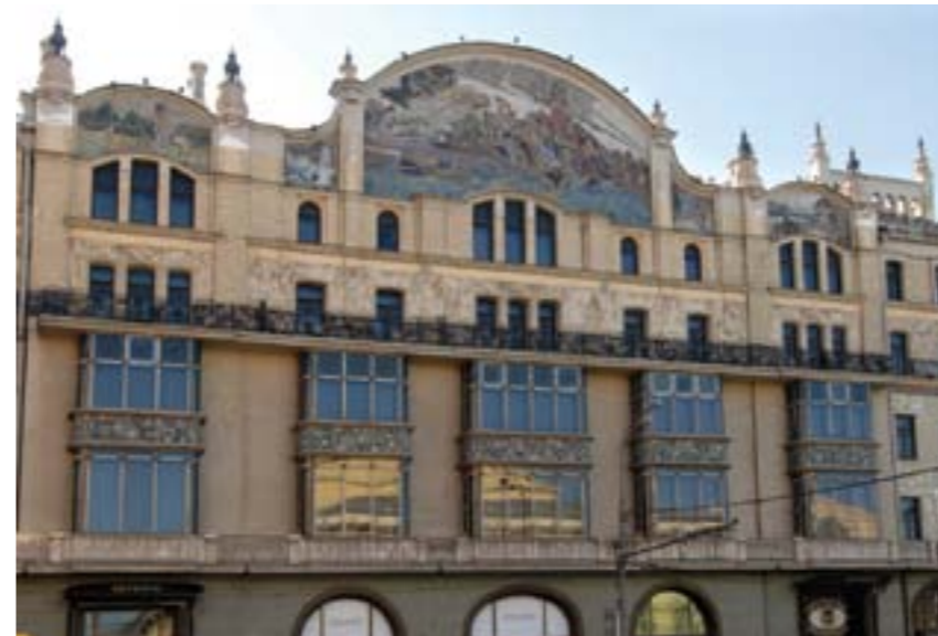
Metropol Hotel, 1899-1907, by architects Lev Kekushev and W. Walcot, with ceramics by M. Vruvel and A. Golovin

Al damunt de l'entrada, la mirada se sent atreta per un mosaic –atribuït per alguns a William Walcot– on s'hi representen habitants del fons marí, com peixos i llagostes.