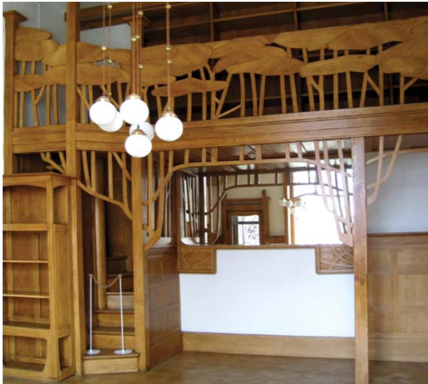
F.O. Shekhtel, 1901. Derozhinskaya House / F.O. Xèkhtel, 1901. Casa Derojinski

L'exemple més perfecte d'un temple moscovita en estil modernista neorus el tenim en l'església Pokrovski, construïda els anys 1908-1912 al Convent de la Misericòrdia de Marta i Maria. El convent va ser fundat per la gran duquesa Elizaveta Fiódorovna, germana de l'emperadriu Alexandra, després de l'assassinat a mans dels terroristes del seu marit, el general i governador de Moscou, el gran duc Serguei Alexàndrovitx. En el projecte, l'arquitecte Xússev va emprar àmpliament els mètodes de l'arquitectura de Nóvgorod i Pskov dels segles XII-XIV, però va conferir als antics motius una nova tonalitat de conte i llegenda. És per això que el temple té forma rabassada, amb una cúpula enorme en forma de casc, i finestres baixes i estretes. En les parets blanques i llises amb exigua decoració de maó, hi van muntats els fragments d'esplèndida pedra tallada, obra de l'escultor S. T. Koniònkov. Destaca l'entrada principal del temple: entre dos campanars