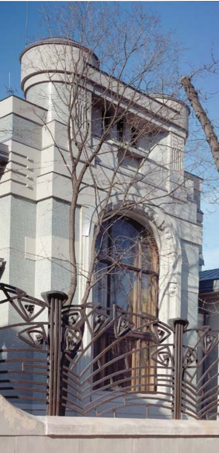
F. O. Shekhtel, 1901. Derozhinskaya House