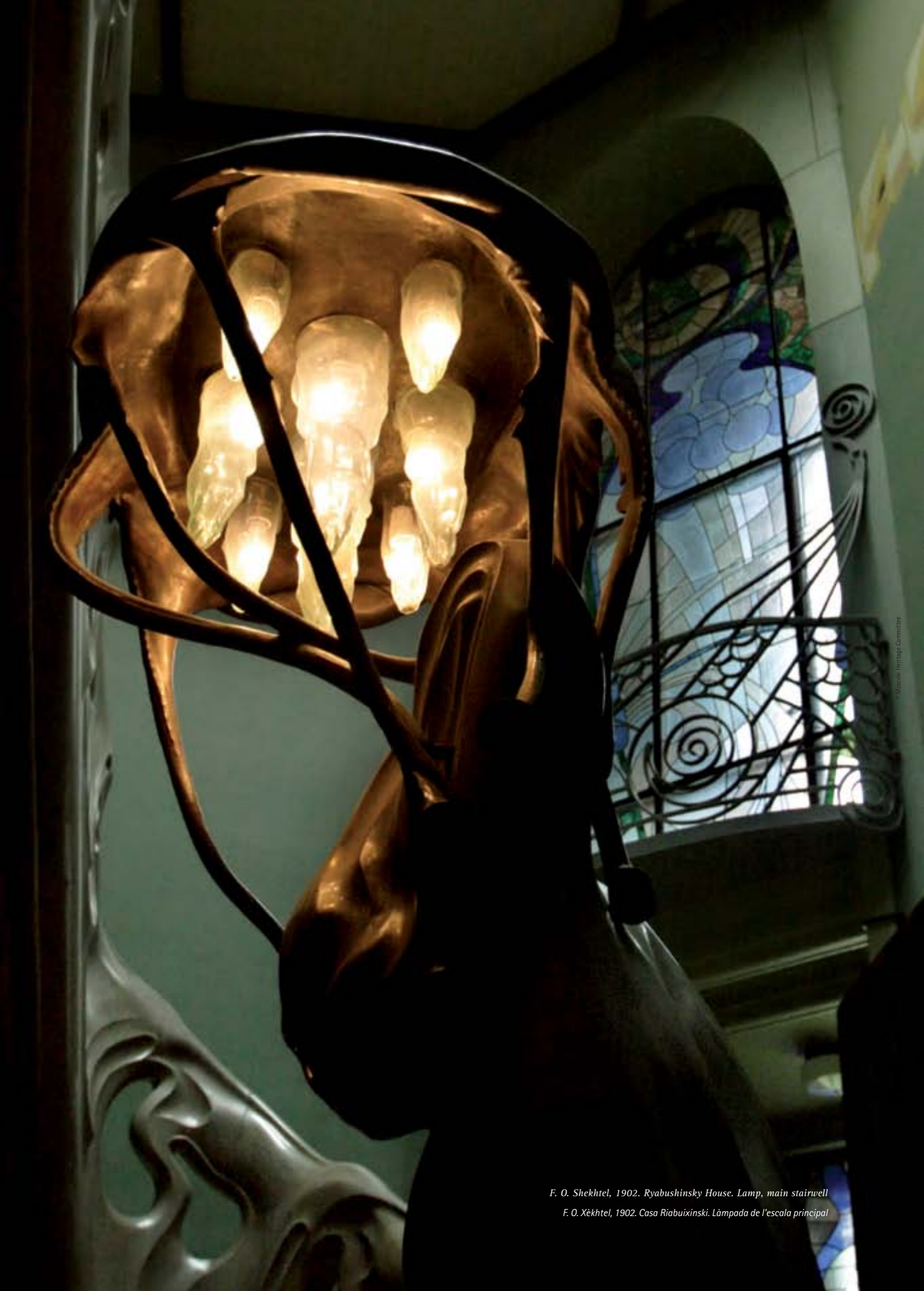
F. O. Shekhtel, 1902. Ryabushinsky House. Lamp, main stairwell

Si cap a finals de la primera dècada de 1900 la construcció en estil modernista europeu occidental va començar a minvar en la pràctica i amb l'inici de la Primera Guerra Mundial va desaparèixer completament, les obres de tendència neorussa van continuar explorant nous temes arquitectònics de la Rússia medieval, i les capelles i temples van adquirir una especial vigència.