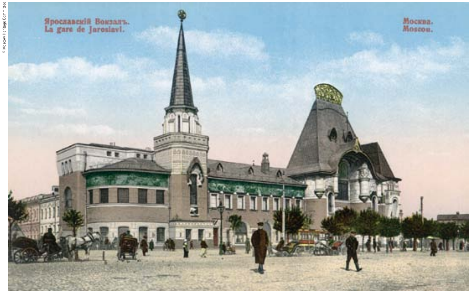
Period postcard depicting Yaroslavsky Rail Terminal / Postal d'època de l'estació de tren de Iaroslavsk

of the contributions of many architects and artists. Savva Mamontov was the promoter of this huge, multi-faceted construction in the heart of the city. A talented singer, "Savva the Magnificent" dreamed of locating the new Private Russian Opera there. Building began in 1899 according to plans by Lev Kekushev, but Mamontov soon decided