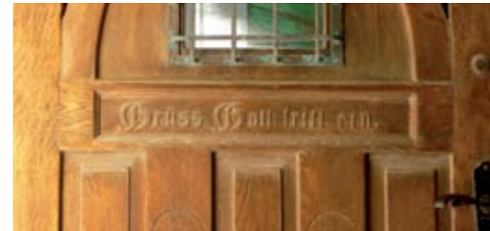
The inscription in the entrance hall is the first part of a German saying that could be translated as "Saying hello brings happiness"

La inscripció de la porta d'entrada és la primera part d'un refrany alemany, que es podria traduir per "Dir bon dia fa entrar la felicitat"