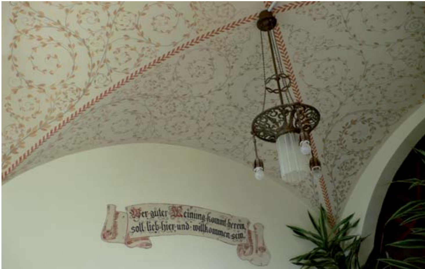
The entrance hall has some delightful detailing on the vaulted ceiling. The inscription on the wall reads, "Those who mean well, enter to be loved and welcomed here" Les voltes del vestíbul mostren uns detalls decoratius deliciosos. A la inscripció de la paret hi llegim: "Si veniu per bé, entreu i sereu estimats i benvinguts"