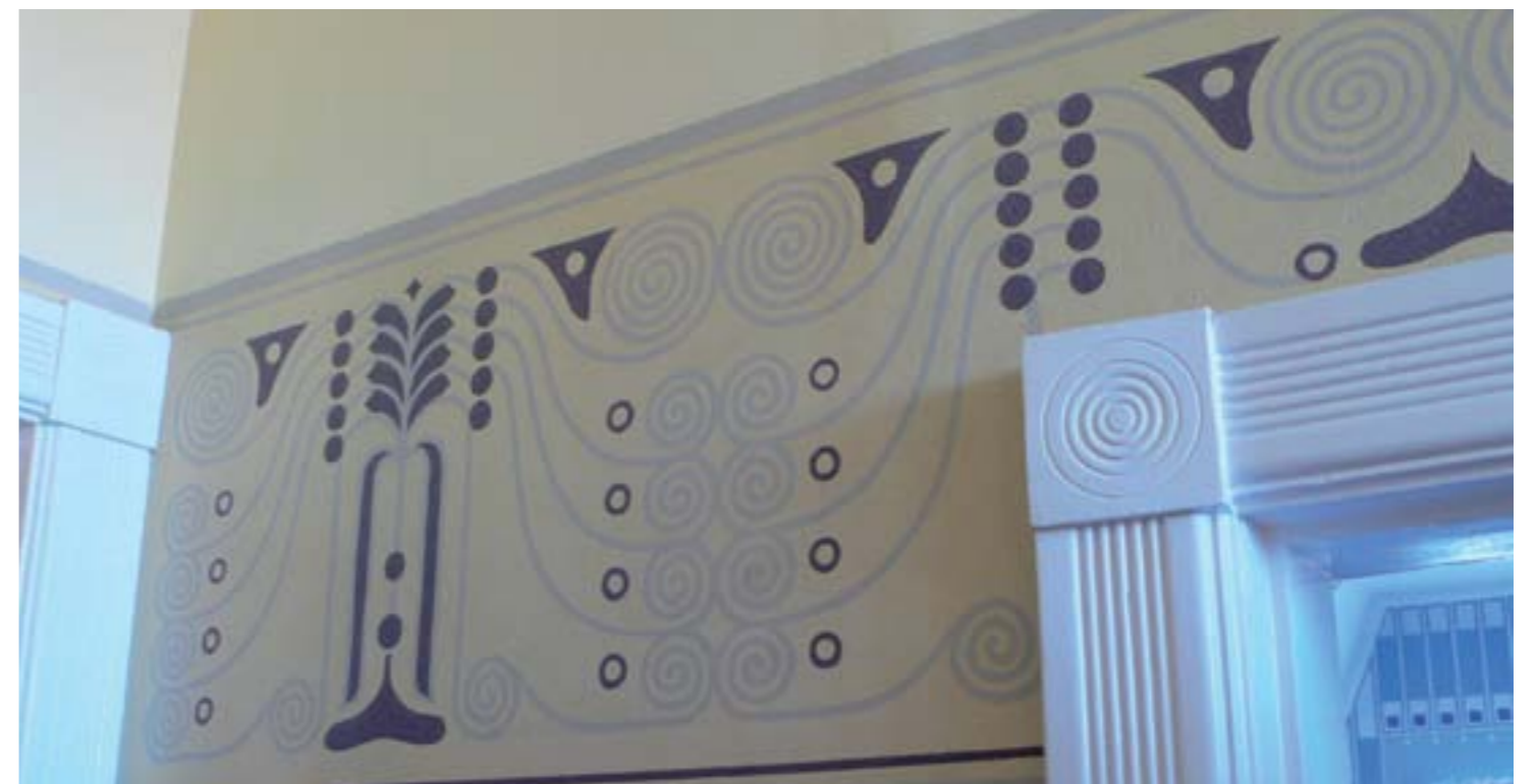
Pure Jugendstil motifs decorate the bathroom wall / Motius del més pur Jugendstil en la decoració mural de la cambra de bany