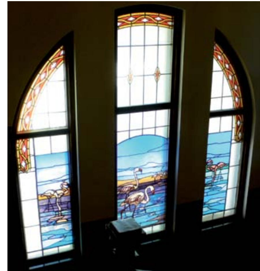
Pink flamingos are the African motif on the stained-glass window on the staircase Els flamencs rosats són el motiu africà del vitrall de l'escala