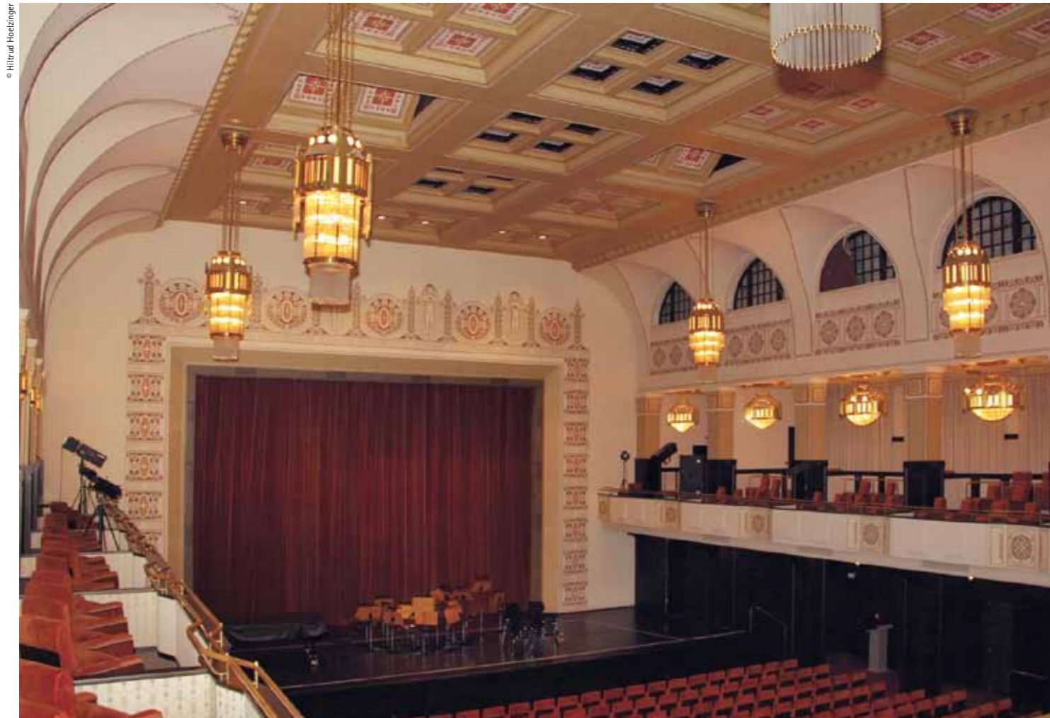
The concert hall: note the ceiling panels that can be opened for ventilation

Vista general de la sala de concerts del teatre: cal destacar els plafons del sostre que es poden obrir per ventilar la sala