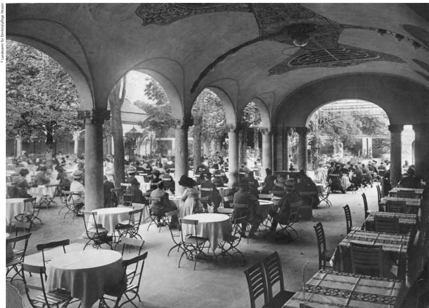
taken in 1910, shortly after Jost's alterations, showing the new porch feta el 1910, poc després de la reforma de Jost, que mostra la nova terrassa porxada

En aquella època, els visitants es deuen sorprendre tant o més que ara per la grandària i la lluminositat de l'interior d'aquest edifici. Els finestrals deixaven entrar la llum fins a les galeries, fent que els sostres cassettejats semblessin menys pesats, i els tons càlids i clars ressaltaven la senzillesa de la construcció. A part de la decoració pictòrica, els únics motius figuratius presents abans i ara són els quatre joves de sobre l'escenari que porten instruments típics de l'antiga Grècia, obra del pintor Gustav Nitsche.