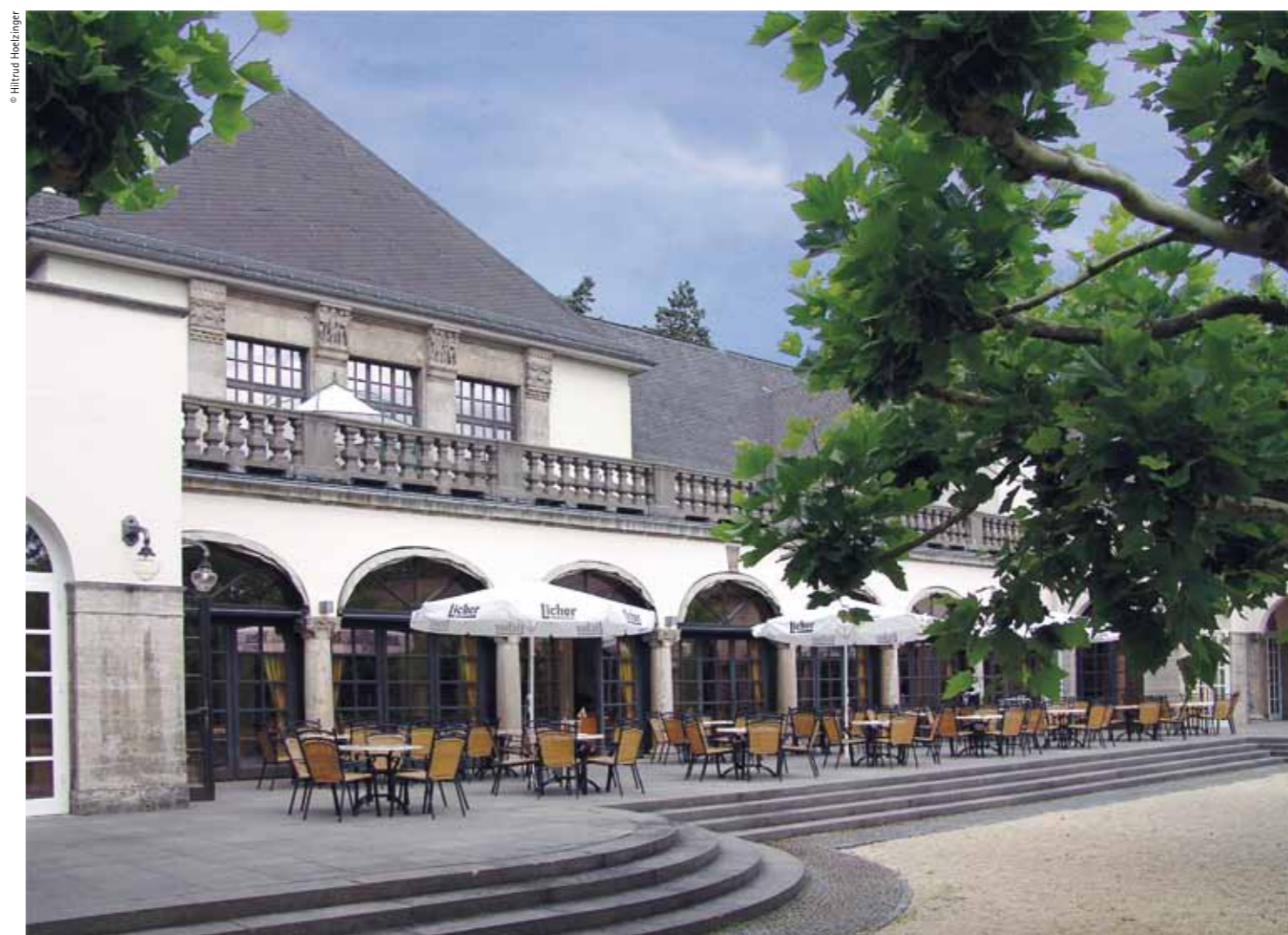
The front of the Art Nouveau Theatre today / Aspecte actual de la façana de l'Art Nouveau Theater

Visitors entering the building then must have been even more surprised than we are now by the size and brightness of the spacious interior. Large windows brought light into the galleries and softened the heaviness of the coffered ceiling, and light, warm tones