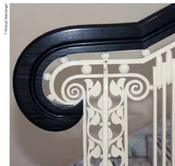
Detail of the main staircase