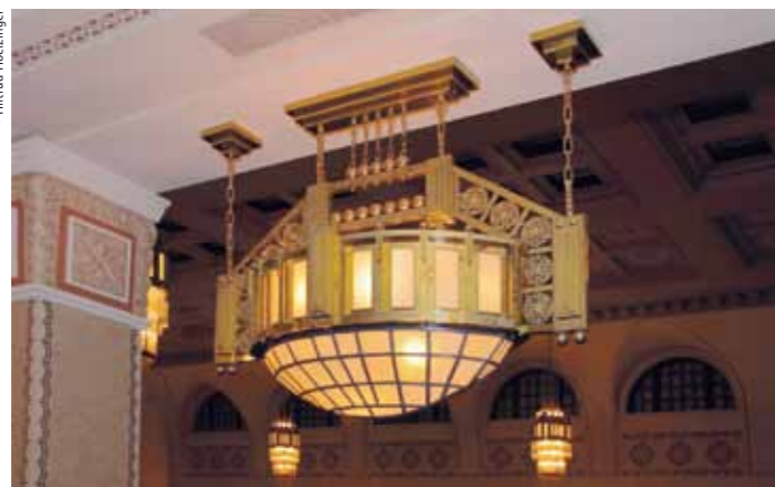
The original lamps in the concert hall have been faithfully reproduced

Després de la Primera Guerra Mundial, la sala de concerts va ser convertida en un teatre i una òpera. En les dècades següents, es va anar canviant la decoració interior per adequar-se als gustos contemporanis. L'any 1980, un incendi va arrasar l'edifici, deixant-ne només les parets en peu. Els propietaris del centre termal i les autoritats estatals van decidir