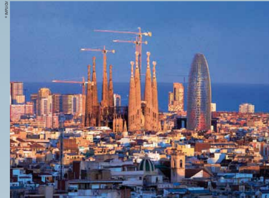
Coexistence of very diverse architecture in Barcelona: Gaudi's Sagrada Família and Jean Nouvel's Water Tower

This collective effort to improve the city's image was accompanied by an imaginative, committed policy of tourist promotion. Along with campaigns abroad to publicise this modern, dynamic Barcelona—a far cry from that sad image of a backward country lacerated by Franco, merely offering sun, sand and cheap food—specific initiatives were promoted to reinvent this territory. For example, the Bus Turístic—a double-decker bus that can shed its roof, an ideal option for appreciating the architecture—offers a glimpse of the entire city in just a few hours for a reasonable price. One might also mention the City Council's outstanding support for extending the offer of quality hotels. Hand in hand with the necessary infrastructures for the Olympic Games went