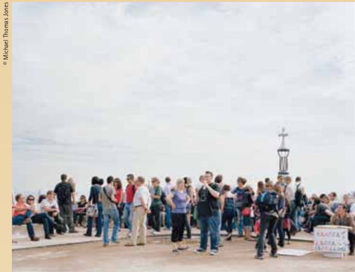
Gaudí's multicoloured bench (right) does in fact exist, although it is not always visible and remains hidden under the backsides of the same tourists that swarm into Park Güell to see it (left) El banc de trencadis de Gaudí realment existeix (dreta), tot i que no sempre es pot admirar, amagat com queda sota els culs dels turistes que envaeixen el Park Güell per veure'l (esquerra)