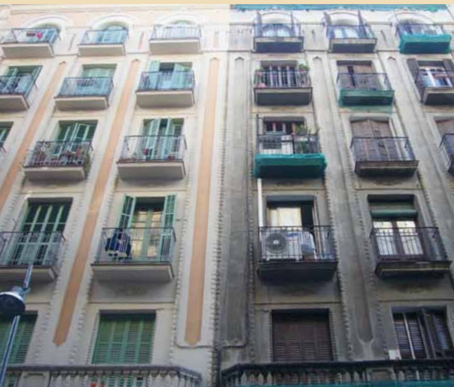
The impact of Barcelona posa't guapa on the improvement of the landscape becomes evident when twin buildings, one of which not yet restored, are compared

Però els 15 dies de Jocs de 1992 no ho poden explicar tot: altres ciutats han estat seus olímpiques i no han registrat un creixement tan espectacular de l'interès mundial per visitar-les. El fet és que els