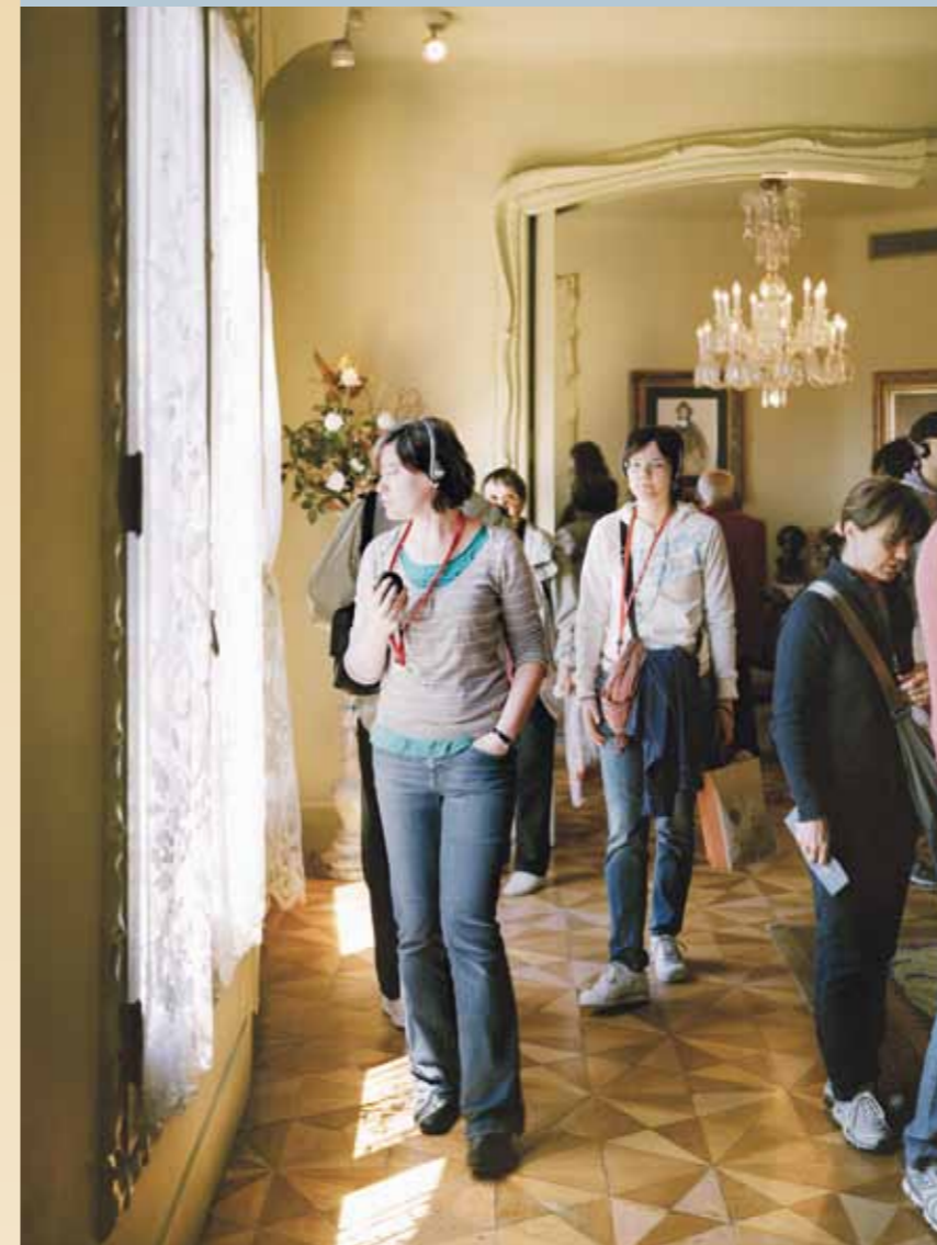
El Pis de La Pedrera, a modern reconstruction of a 1900 bourgeois home, was in 2010 the most visited museum in the city