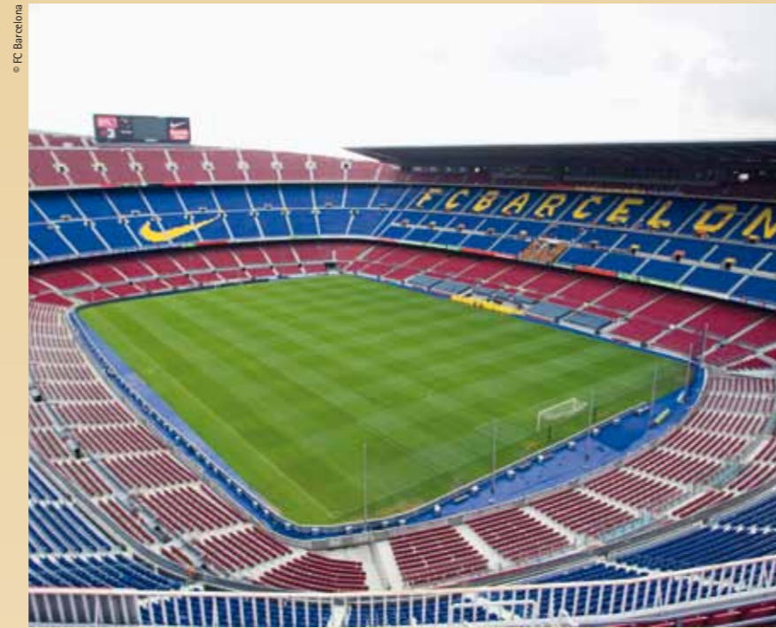
The Barcelona Football Club Stadium was the most visited monument in the early 1980's

Caldria afegir-hi l'estadi del Futbol Club Barcelona, que aleshores era el monument que rebia més visites, i el Museu del Barça, el museu que venia més entrades de la ciutat. Avui, en canvi, els museus més visitats