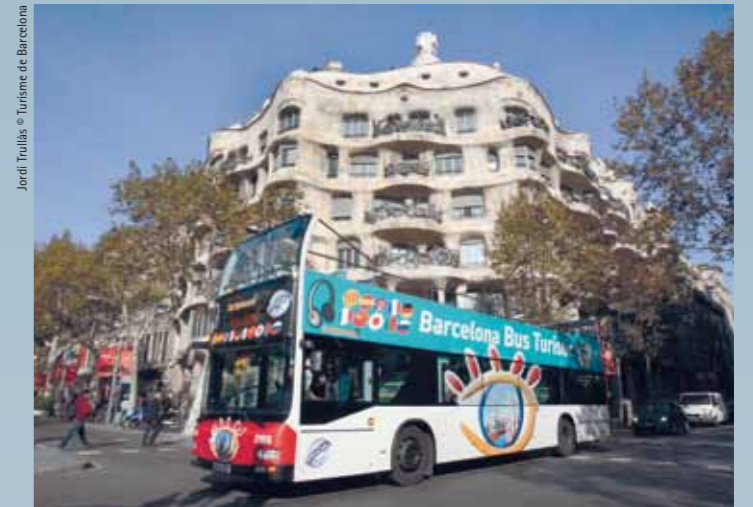
Barcelona's Bus Turístic passing by La Pedrera. Some 2 million tourists use this transport system every year

In terms of its Modernista heritage, in 1997 the Barcelona Modernisme Route was invented, an urban itinerary that led visitors through the best examples of this architectural style—not an easy selection in a city with almost 2,000 listed Modernista buildings! The underlying objective, beyond simple tourist promotion, was to create a brand that could popularise Art Nouveau among Barcelona residents. This would thereby stimulate restoration and maintenance of Modernista buildings, encouraging owners and property promoters to perceive the value of this