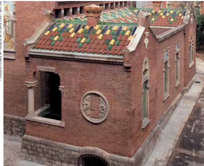
Fundació Privada de l'Hospital de la Santa Creu i Sant Pau