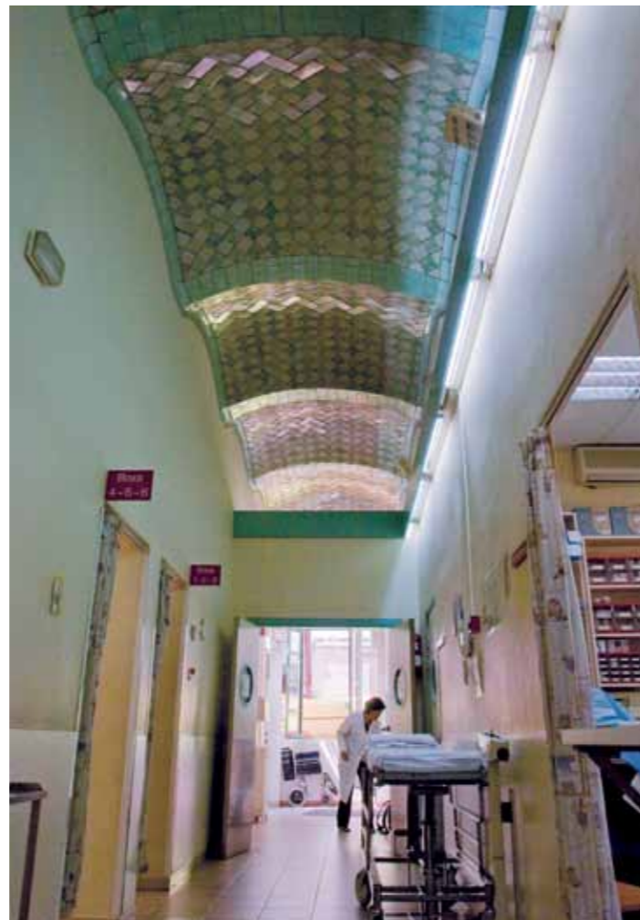
Interior of the Sant Jordi pavilion when still in use as a hospital: the vaulted ceramic-inlaid ceiling was the only visible original element