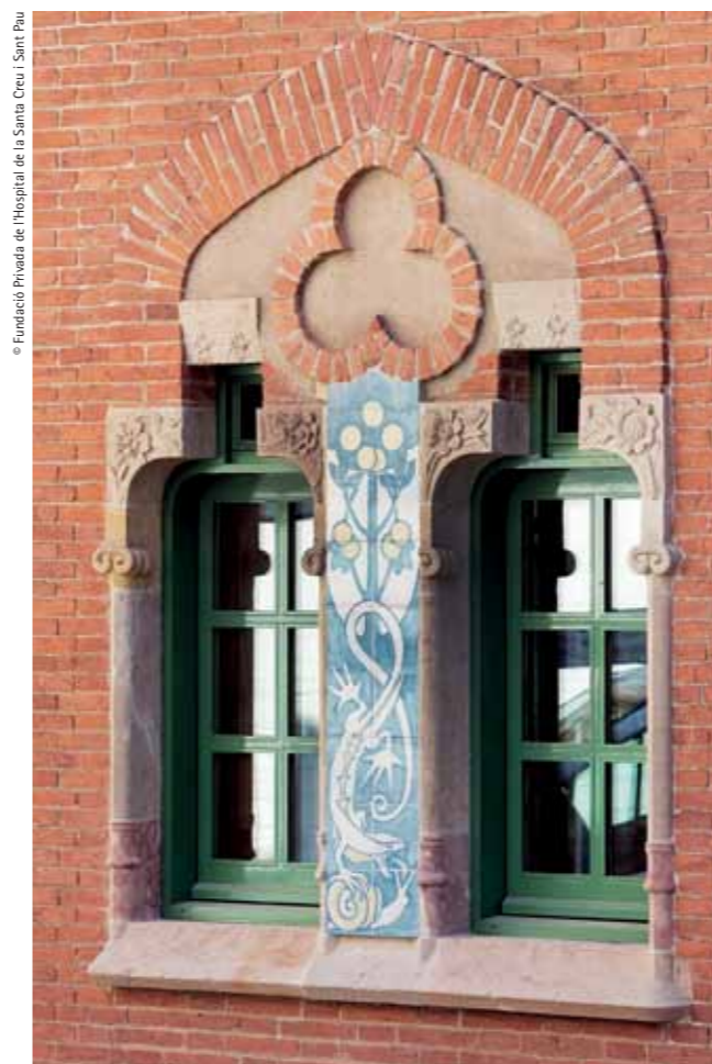
Window of the Sant Jordi pavilion, after restoration