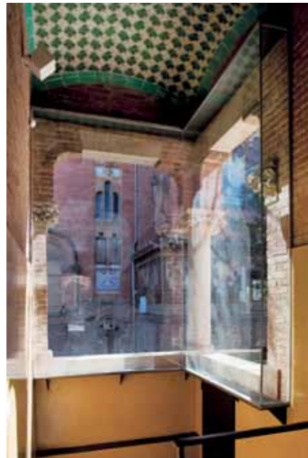
Fundació Privada de l'Hospital de la Santa Creu i Sant Pau