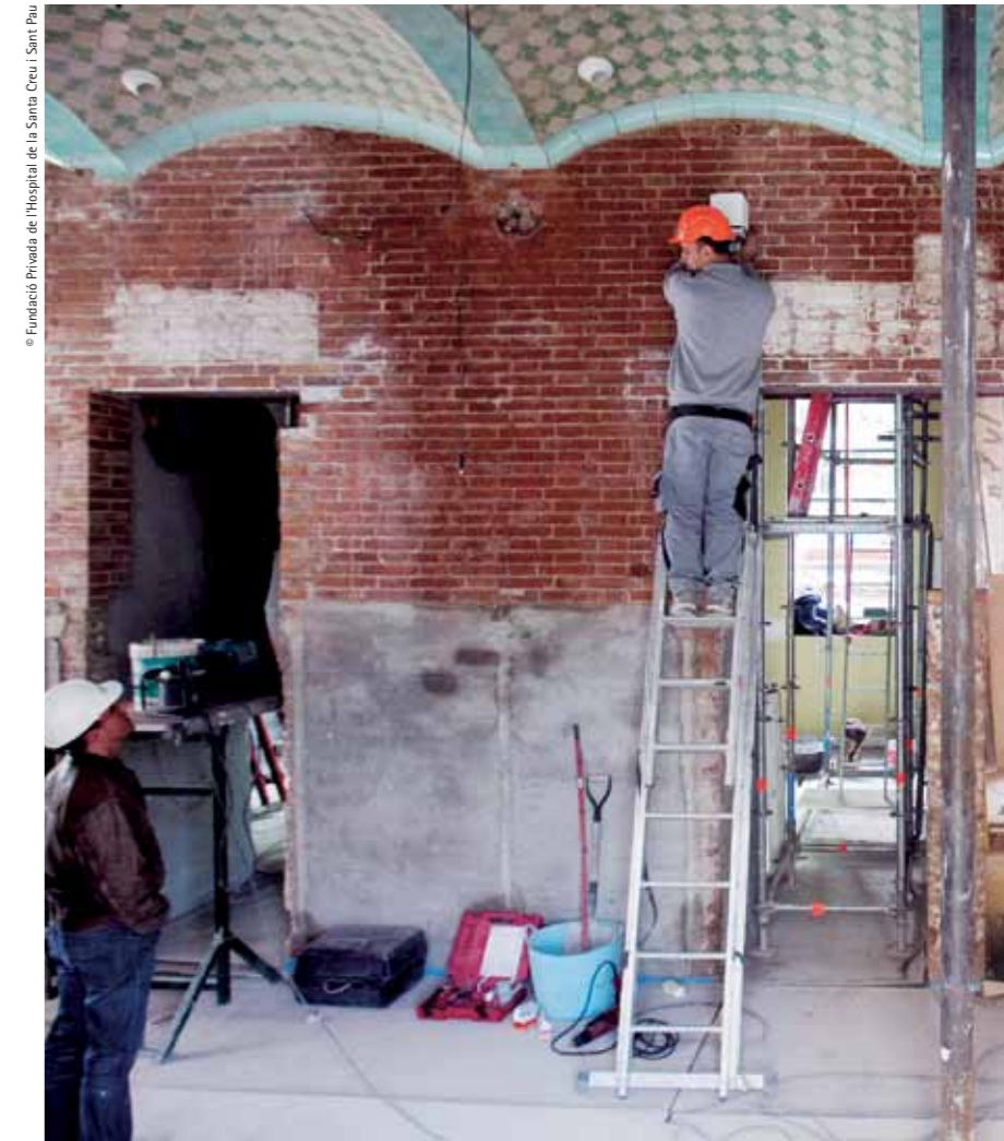
Fundació Privada de l'Hospital de la Santa Creu i Sant Pau