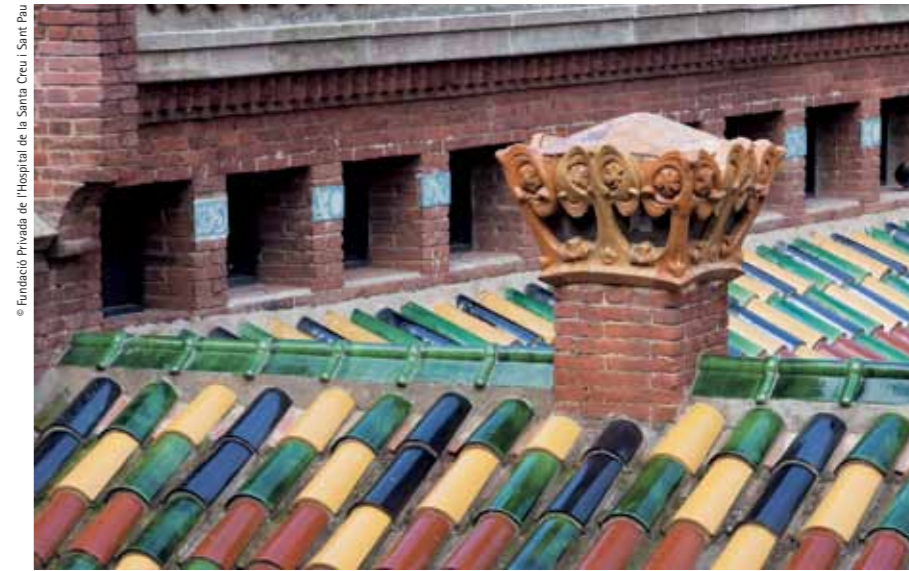
The barrel tiles of the pavilions' roofs have recovered their original colourful enamel splendour

When first built, they had a similar U-shaped structure consisting of a double-storied central block and two lower volumes, with an uncovered central porch. However, in the 1950s, the pavilions underwent several transformations, resulting in their current rectangular shape with covered central patio.