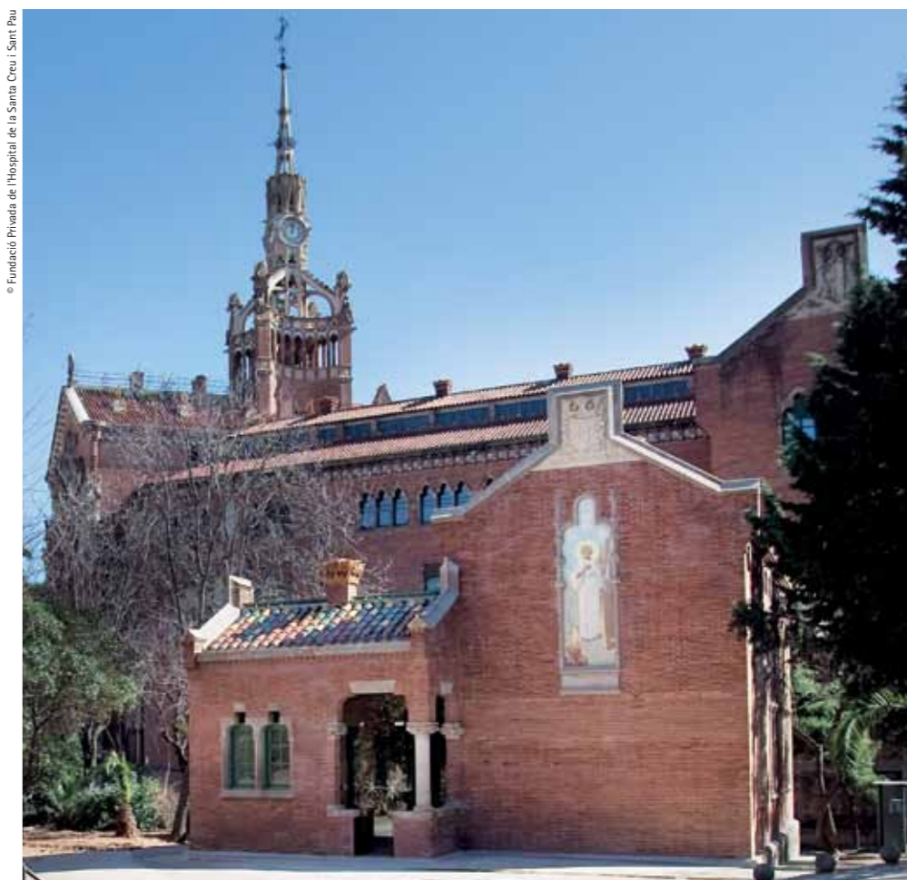
The restored Santa Apol·lònia pavilion, with the larger Administration pavilion, now undergoing restoration, behind