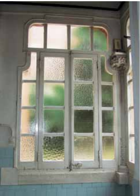
Fundació Privada de l'Hospital de la Santa Creu i Sant Pau