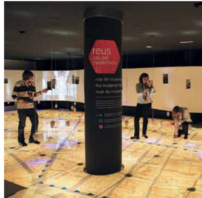
Space devoted to the Reus Modernisme Route (first floor) Espai dedicat a la Ruta del Modernisme de Reus (primera planta)

Des de l'inici del projecte, el Gaudí Centre va voler allunyar-se del model més tradicional de museu i va apostar pel desenvolupament d'un equipament didàctic i interactiu, que amb rigor científic i històric es dirigís a totes les edats i tingués diferents nivells de lectura. El Gaudí Centre