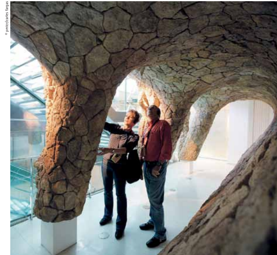
Recreations and settings of Gaudí's work: Reproduction of a part of Park Güell Recreacions i escenografies de l'obra de Gaudí: reproducció d'un espai del Park Güell