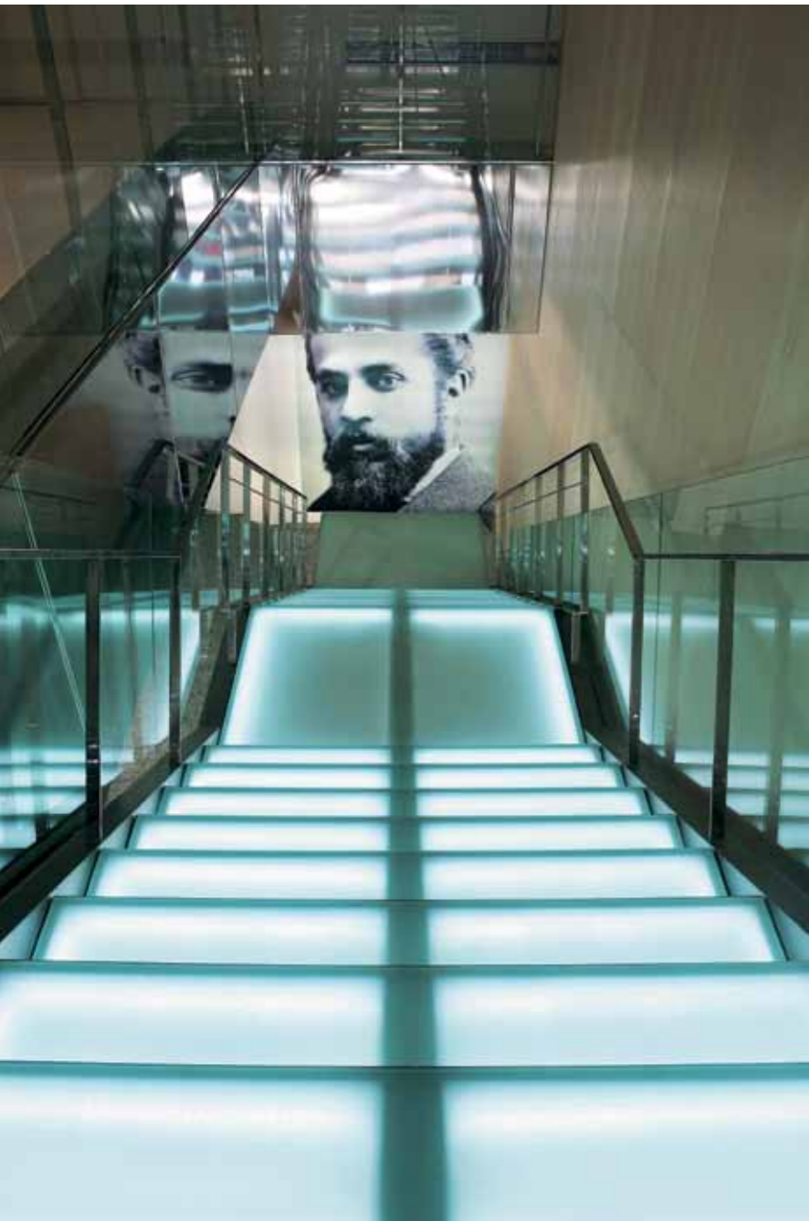
At the bottom of the stairs one can see one of the few photos taken of the architect Al fons de l'escala es pot veure una de les poques fotografies fetes a l'arquitecte

L any 2002, Any Internacional Gaudí, l'Ajuntament de Reus va decidir dedicar un centre d'interpretació a l'arquitecte Antoni Gaudí amb un doble objectiu: rendir homenatge al personatge més il·lustre de la ciutat i identificar definitivament el geni amb Reus, el seu lloc de naixement. A partir d'aquest moment es va encomanar al Patronat Municipal de Turisme i Comerç de Reus la responsabilitat de gestionar aquest nou espai, que va obrir les seves portes el 25 de juny de 2007, data en què es commemorava el 155è aniversari del naixement de Gaudí.