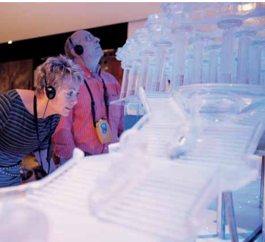
Interactive model of the hypostyle hall in Park Güell: a good way to understand Gaudí's architecture