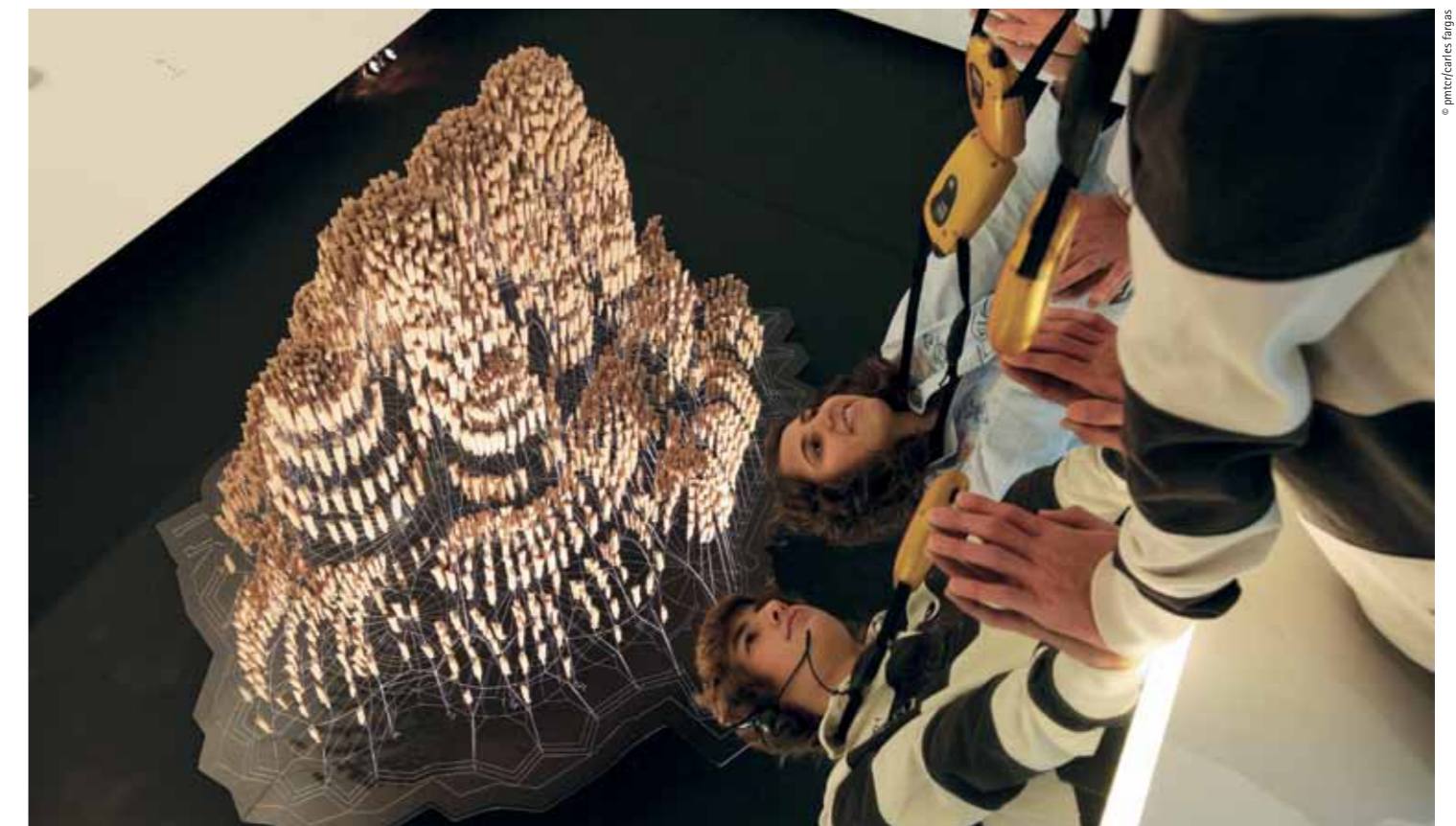
The funicular model for the church of the Colònia Güell reproduces the volume that this building should have taken, of which only the crypt was ever built La maqueta funicular per a l'església de la Colònia Güell reproduceix la volumetria que havia de tenir aquest edifici, del qual només es va arribar a construir la cripta