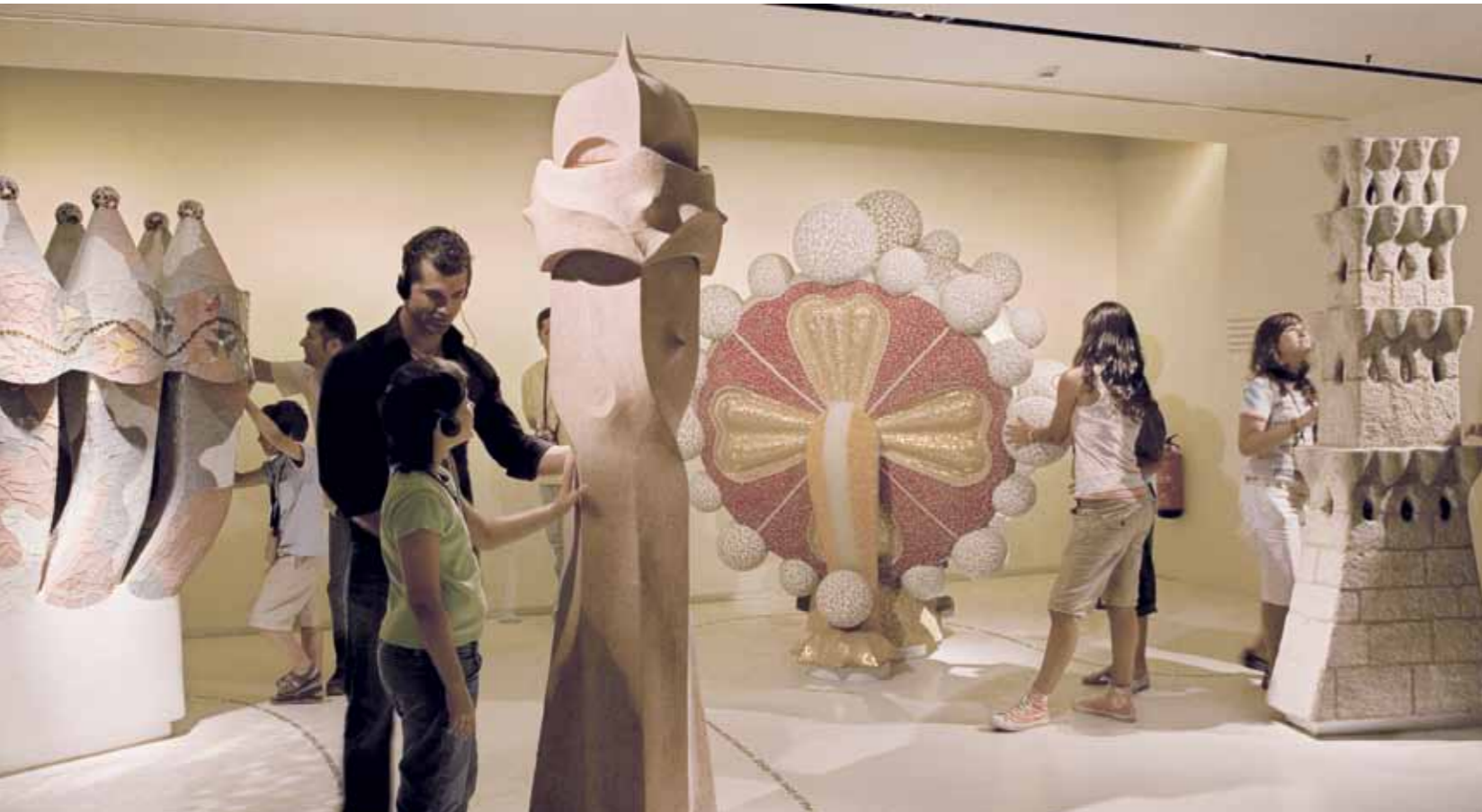
In this space visitors can touch and experience first-hand the different reproductions on display En aquest espai els visitants poden tocar i experimentar amb les diferents reproduccions que s'hi exposen