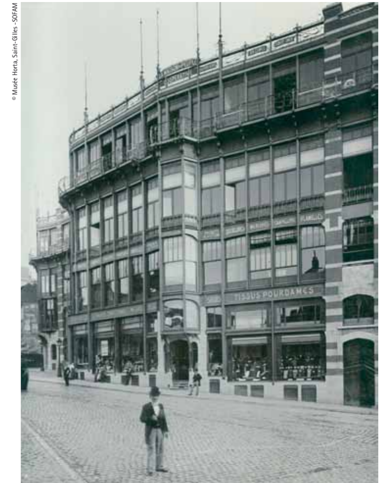
© Musée Horta, Saint-Gilles - SOPAM