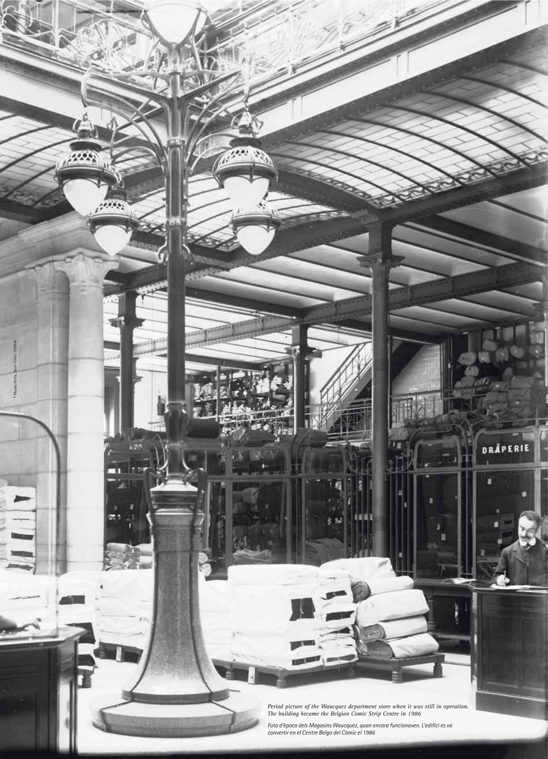
Period picture of the Waucquez department store when it was still in operation. The building became the Belgian Comic Strip Centre in 1986