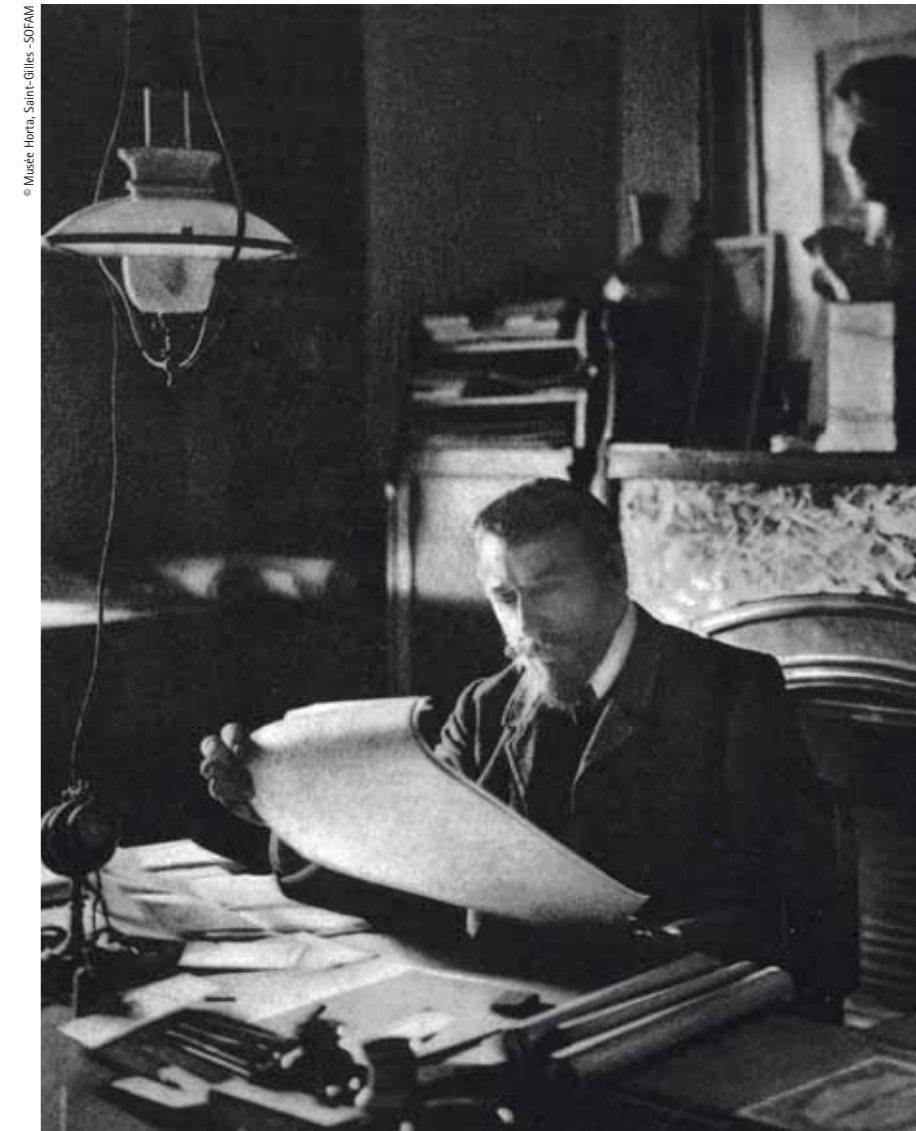
Horta working in his office, around the year 1902 Horta treballant al seu despatx, pels volts de 1902