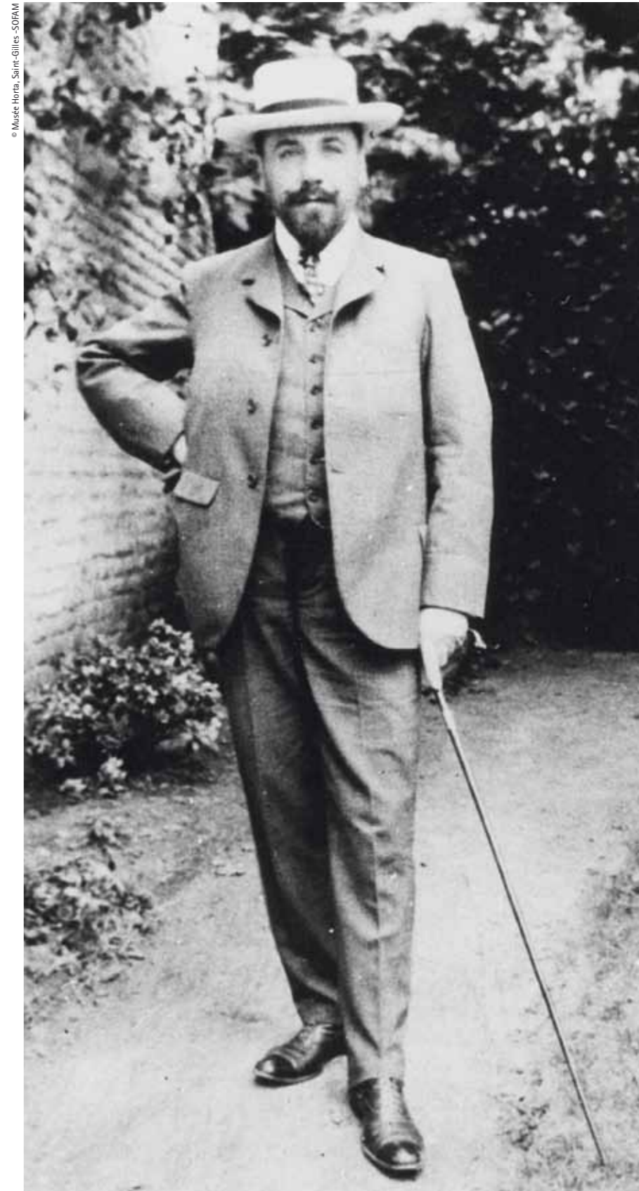
A young Victor Horta, ca. 1890

Horta adapted his houses to their owners' lifestyles, creating comfortable ground-floor cloakrooms and parlours. He furnished an open mezzanine above the stairwell to house a smoking or billiards room. He breaks the symmetry and opens windows in the façade that are proportional in size to the importance of the rooms they light. He is the first architect to utilise iron structures in Bourgeois architecture. Thanks to this, there is no need to alternate solids and spaces. He tries to give the metal a form that conveys the material's malleability, imagining compositions of arabesques that he situates according to need in windows, on wrought iron, mosaics or murals. Thematically, he describes the force of nature that pushes plants towards the light. Yet while nature inspires him,