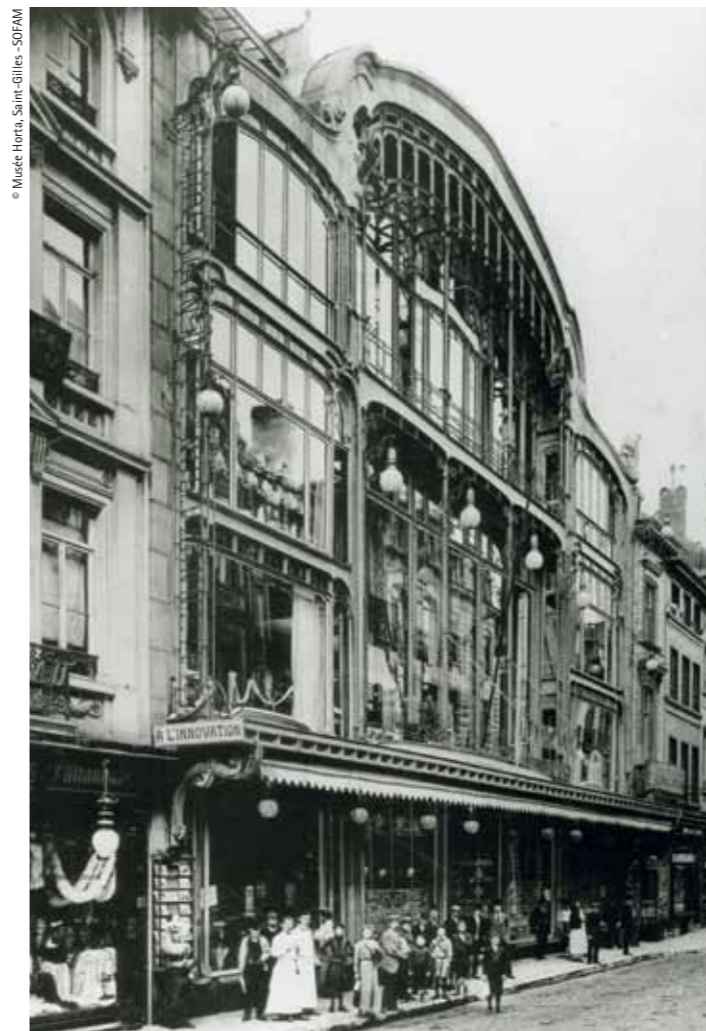
The Brussels department store À l'innovation (1900-1903) was destroyed by a fire in 1967

Els grans magatzems de Brussel·les À l'innovation (1900-1903) van ser destruïts el 1967 per un incendi