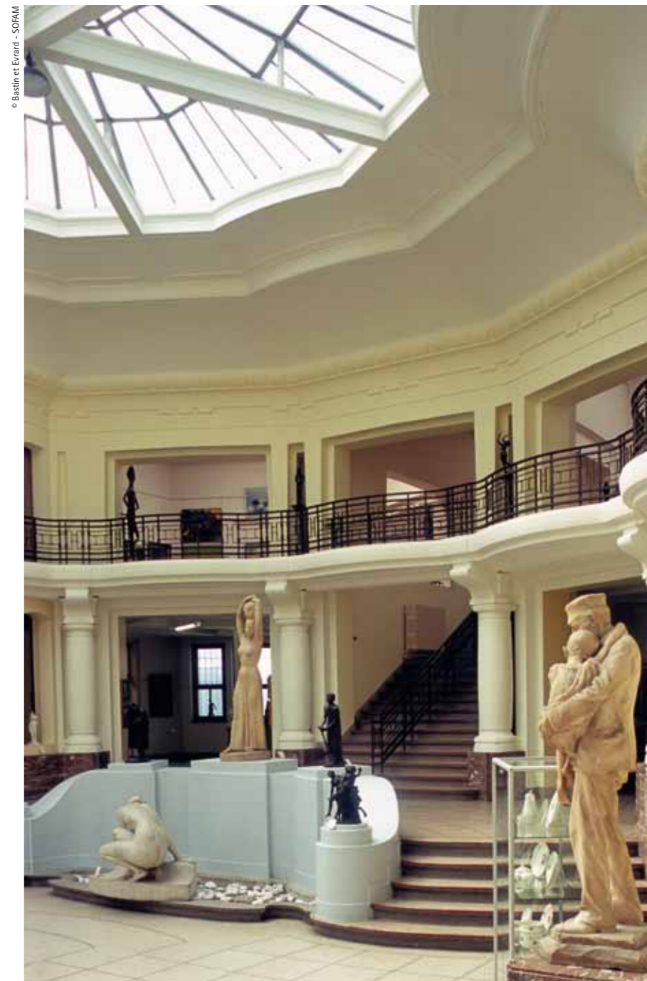
Central hall of the Tournai Musée des Beaux-Arts: Horta drew up the plans in 1907, but it was not completed until 1928