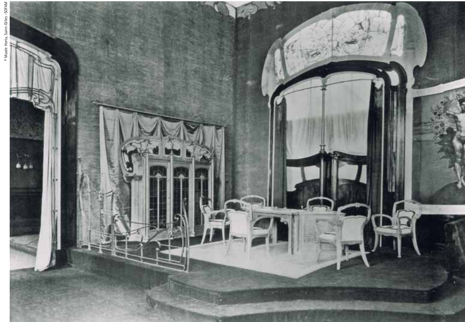
The bureau-library presented by Horta at the 1902 Turin International Modern Decorative Arts Exhibition became an instant success and made him known worldwide L'oficina-biblioteca presentada per Horta a l'Exposició Internacional de les Arts Decoratives Modernes de Torí el 1902 va ser un èxit immediat i el va projectar internacionalment