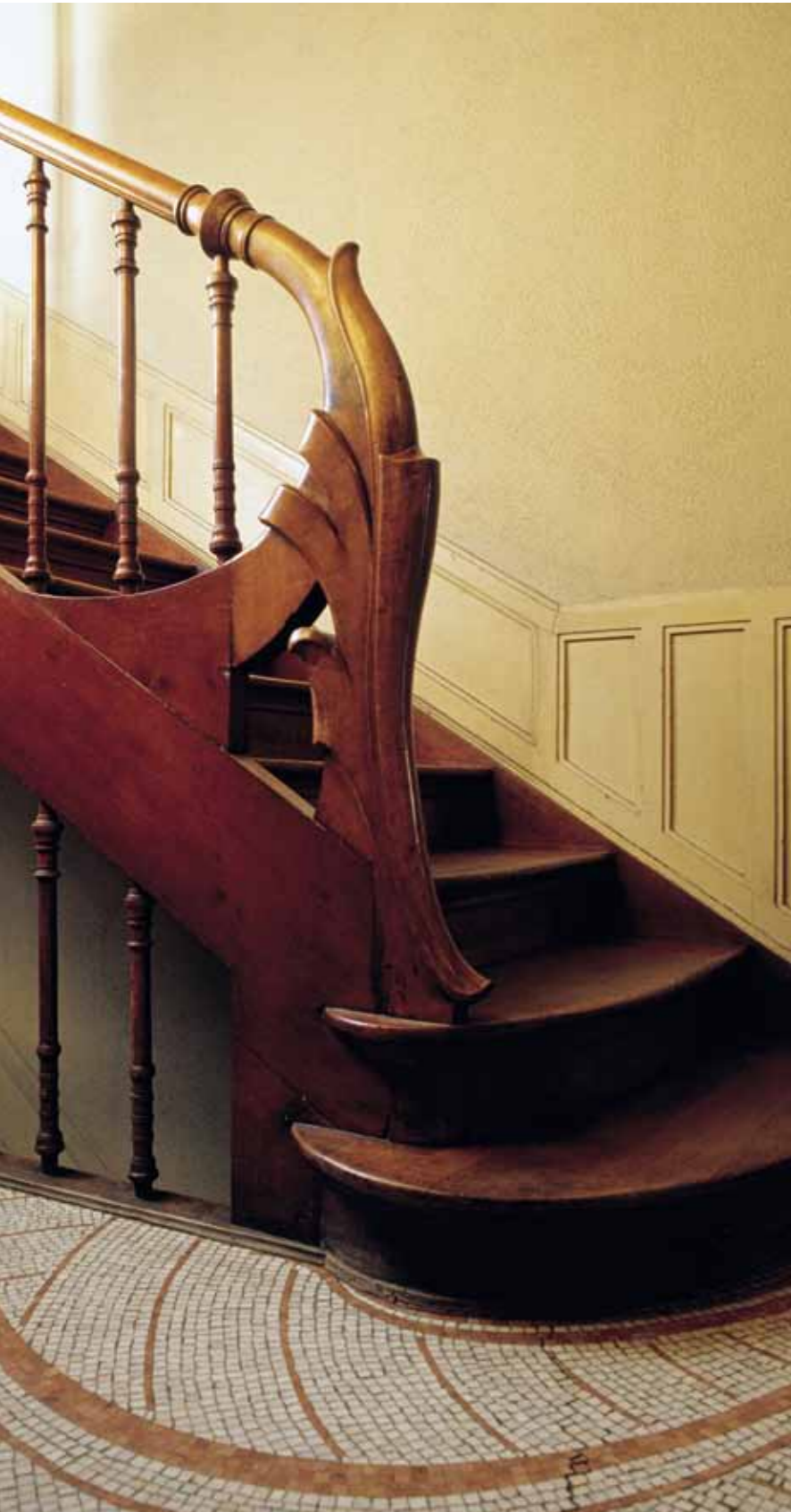
Staircase in the interior of Maison Autrique: in 1893 Horta was transitioning into Art Nouveau

A l'Hôtel Tassel, els fons de colors en degradat de les pintures murals evocuen les estampes japoneses que col·leccionava el propietari de la casa. El mateix Horta havia estat subscriptor de la famosa revista del marxant Siegfried Bing, Le Japon artistique . La moda japonesa era present aleshores