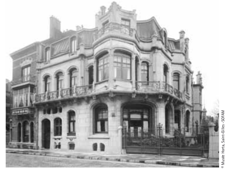
The Aubecq Mansion, built in 1899-1902, was demolished in 1950, but the stones of the façade were kept and there are plans to rebuild it in an appropriate space in Brussels