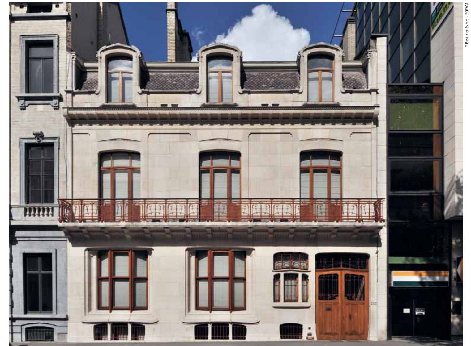
Façade of the house that Horta built in 1902 for the lawyer and politician Max Hallet / Façana de la casa que Horta va dissenyar el 1902 per a l'advocat i polític Max Hallet