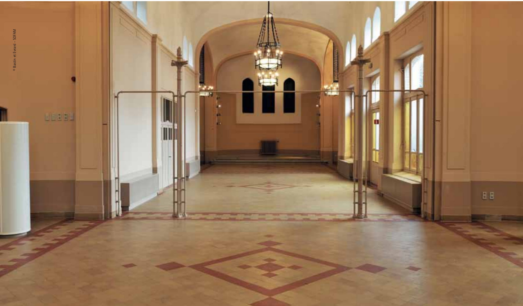
Interior of the chapel of the Brugmann Hospital that Horta built in Jette, near Brussels, between 1906 and 1923. The draught-screen in the centre separated two distinct areas, for Catholic and for non-confessional ceremonies