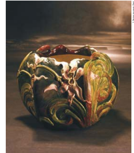
Orchidées (Orchids), ca.1897. Stoneware flowerpot holder made for Emile Müller & Cie. Design Museum Gent, inv. nr. 80/301

This consisted mainly in presenting Philippe as the designer of unique, luxury items, preferably at prestigious international exhibitions.