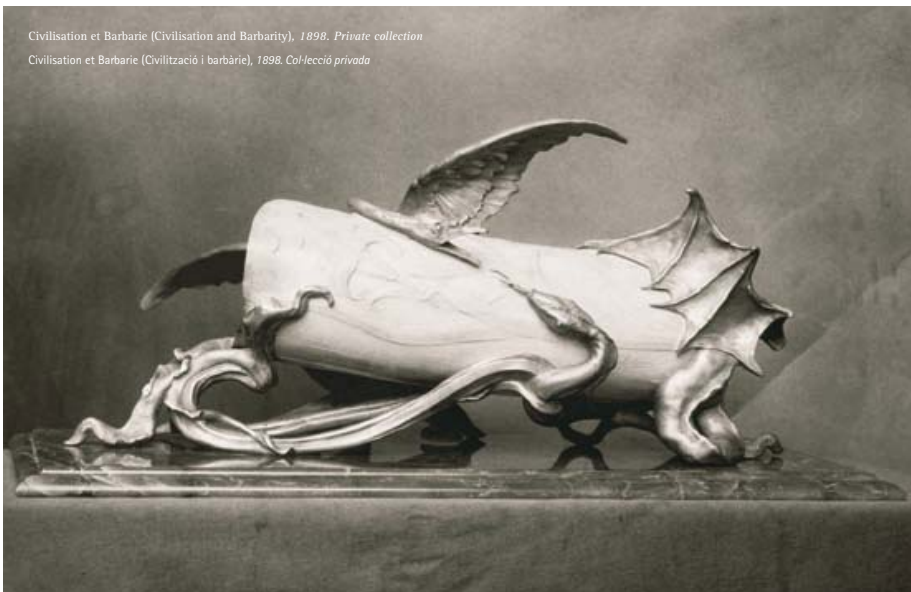
Civilisation et Barbarie (Civilisation and Barbarity), 1898. Private collection