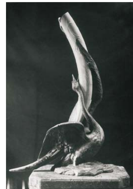
La Cresse du Cygne (The Swan's Caress), 1897. Archives private collection La Cresse du Cygne (La carícia del cigne), 1897. Col·lecció privada

The highlight was the International Exhibition of Brussels in 1897. For the Wolfers stand, Philippe designed a sumptuous decor combining gilded bronze and walnut. Shown were both personal, signed creations and anonymous designs that he had also done for