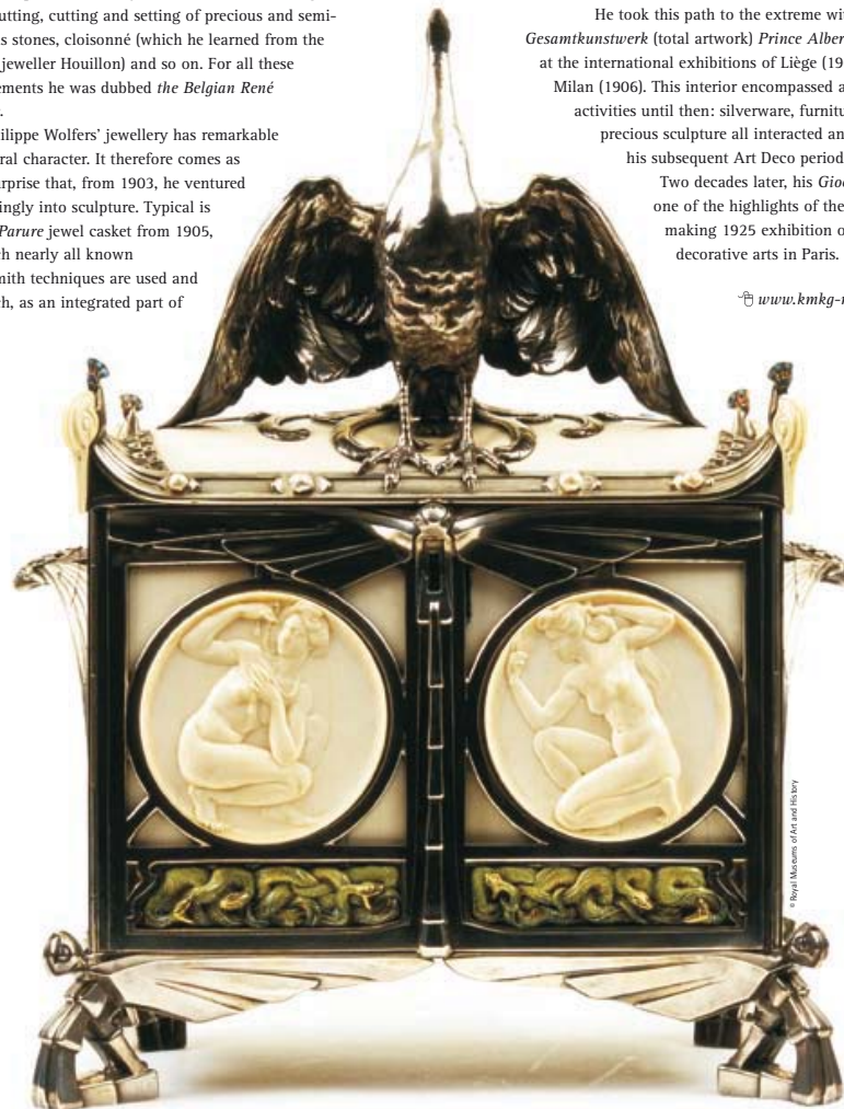
La Parure (The Ornament), 1905. Jewel casket. Royal Museums of Art and History, inv. 7032 La Parure (L'adornament), 1905. Cofre per a joies. Royal Museums of Art and History, inv. 7032