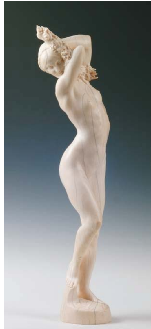
Printemps (Spring), 1913. Ivory statue. Royal Museums of Art and History, inv. Sc. 190 Printemps (Primavera), 1913. Estàtua de marfil. Royal Museums of Art and History, inv. Sc. 190

The objects were made in his father's workshops, rightly renowned for their high degree of perfection and finish. The silver objects he showed at various important exhibitions from 1895 created a tsunami in the otherwise calm circle of leading silversmiths. The new rich bourgeoisie did not want mere copies of the old silver of the nobility and silversmiths started creating new luxury products influenced by the Wolfers pieces, frequently