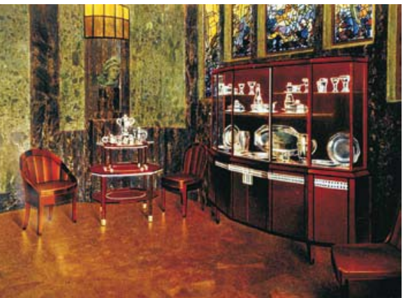
Gioconda. Dining room ensemble for the International Exhibition of Modern Industrial Arts, Paris 1925. Private collection