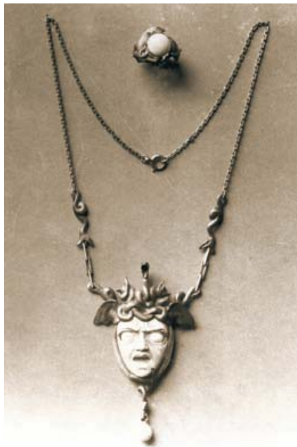
Méduse (Medusa) pendant and Poissons (Fish) ring, 1898. Private collection Penjoll Méduse (Medusa) i anell Poissons (Peixos), 1898. Col·lecció privada

Les joies de Philippe Wolfers tenen un caràcter escultural remarcable. I per tant no sorprèn el fet que a partir de 1903 s'aventurés cada cop més en