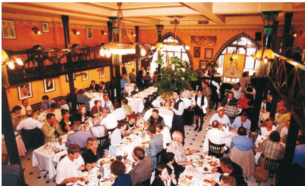
Els assistents al primer Plenari dinant al restaurant Els 4 Gats