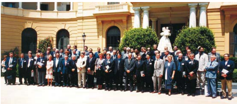
Group photo of the authorities attending the Barcelona plenary meeting of June 2000 / Foto de família de les autoritats assistents al primer Plenari de Barcelona, juny de 2000