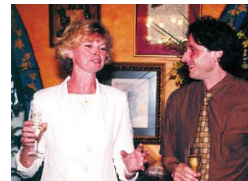
Vice-president of the Brussels Parliament, Marion Lemesre, in a toast to the good health of Art Nouveau with Deputy Mayor Jordi Portabella in the first plenary meeting of June 2000 La vicepresidenta del Parlament de Brussel·les, Marion Lemesre, brinda per la bona salut del patrimoni modernista durant el primer Plenari a Barcelona el juny de 2000