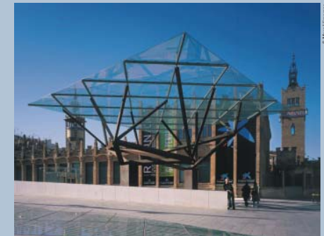
Main entrance of CaixaForum, designed by the Japanese architect Arata Isozaki Entrada principal de CaixaForum, dissenyada per l'arquitecte japonès Arata Isozaki

F ive years ago, CaixaForum opened its doors. From early on, it was a key location for the people of Barcelona and many visitors to the city. One of the things that has made it so attractive has been the interaction between the architectural space and the activities that take place within. The former Casaramona factory, designed by Puig i Cadafalch, is one of the finest examples of industrial Modernism in Barcelona. Opened in 1913, it was a textile factory until 1920. Thereafter, it had a bumpy history and was subject to various uses that damaged much of it. Its resuscitation took place in various stages. Firstly, Francisco Javier Asarta, a topflight specialist in Modernista architecture, was entrusted with the building's consolidation and restoration. Then came the creation