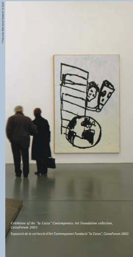
Exhibition of the "la Caixa" Contemporary Art Foundation collection, CaixaForum 2003 / Exposició de la col·lecció d'Art Contemporani Fundació "la Caixa", CaixaForum 2003