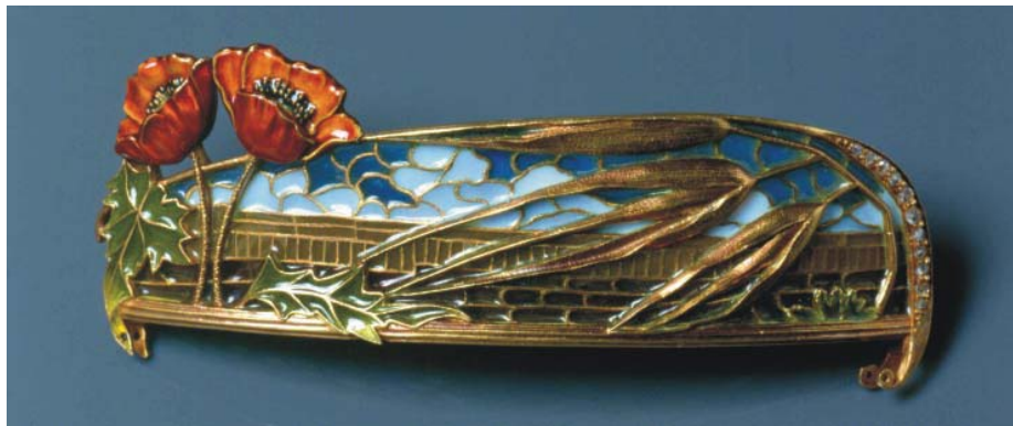
Comb, wheat field with poppies, c1902-1913. Gold, diamonds, translucent plique-à-jour enamel, basse-taille enamel. Private collection Pinta, camp de blat amb roses, ca. 1902-1913. Or, diamants, esmalt translúcid plique-à-jour, esmalt basse-taille. Col·lecció particular