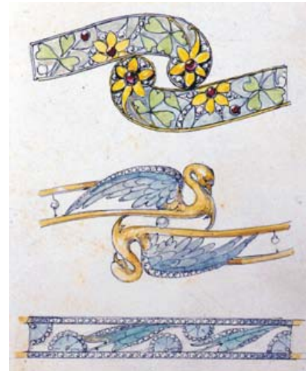
Sketched designs for bracelets, c1903. Bagués-Masriera Collection Esbossos per a braçalets, ca. 1903. Col·lecció Bagués-Masriera