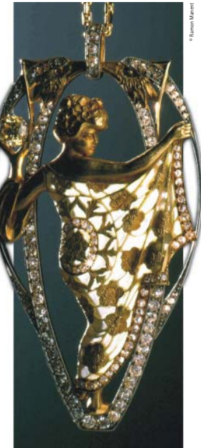
Pendant with ballerina, c1915-1920. Gold, ivory, translucent plique-à-jour enamel, diamonds and sapphires. Private collection