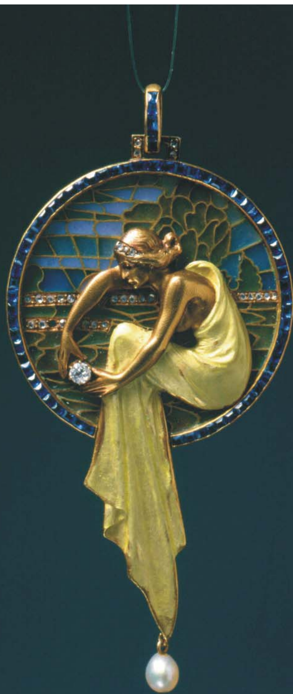
Pendant with nymph, c1908. Gold, sapphires, translucent plique-à-jour enamel, basse-taille enamel and diamonds. Private collection Penjoll amb nimfa, ca. 1908. Or, safirs, esmalt translúcid plique-à-jour, esmalt basse-taille i diamants. Col·lecció particular