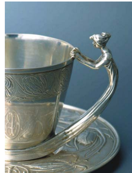
Silver cup and plate / Tassa i plat d'argent

line with the modern and cosmopolitan times marked by the havoc wrought by WWI. In spite of all this, Masriera found it hard to rid himself entirely of the powerful influence of Modernisme. Rafael Benet, one of the sharpest critics of the period, who covered the exposition in the French capital, remarked: "For all he may want to leave the style of 1900 behind, Masriera's art remains steeped in it. The same can be said of Plumet, Lalique, etc. who still bear the mark of an era".