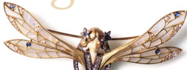
Fastener with woman-dragonfly, c1903. Gold, ivory, sapphires, translucent plique-à-jour enamel and diamonds. Private collection Fermall amb dona-libèl·lula, ca. 1903. Or, ivori, safirs, esmalt translúcid plique-à-jour i diamants. Col·lecció particular

basse-taille i del plique à jour, que, amb el seu efecte vitrall és batejada, en un moment en què els contemporanis de Masriera se'n disputaven el paternitat, com a "esmalt Barcelona".