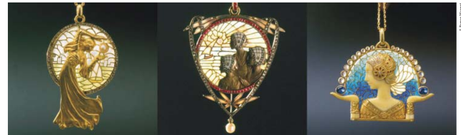
Pendants, c1906-1910. Gold, translucent plique-à-jour enamel, basse-taille enamel and diamonds. Private collection Penjolls, ca. 1906-1910. Or, esmalt translúcid plique-à-jour, esmalt basse-taille i diamants. Col·lecció particular