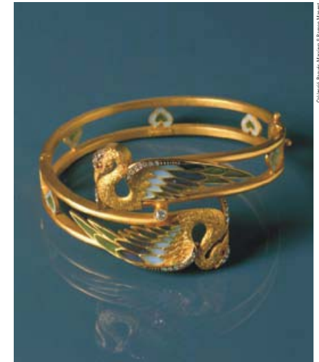
Bracelet with swans, c1903. Gold, translucent plique-à-jour enamel, diamonds and rubies. Braçalet amb cignes, ca.1903. Or, esmalt translúcid plique-à-jour, brillants i rubins.